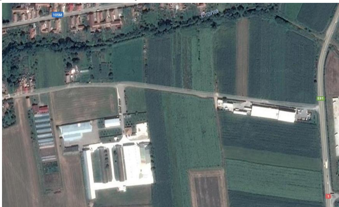
Figura 2: Incadrarea in zona a Fermei 2 Oiejdea