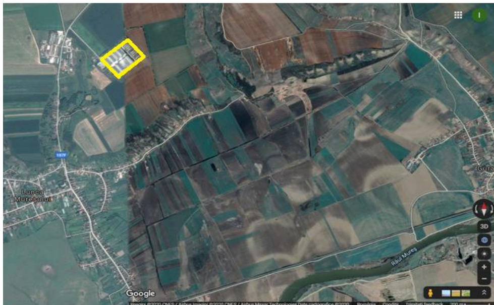
Figura 2.1.1 Localizarea fermei

Localitatea Lunca Mures este situata in partea nord-estica a judetului Alba, aval de confluenta văii Ariesului cu Mureșul, la o distanta de 58 km de municipiul Alba Iulia si la 11 km de Ocna Mures - orasul cel mai apropiat. Localitatea este strabatuta de la nord spre sud-vest de pârâul Grind, care, după confluența in sud-vest cu pârâul Groapa Feldioara, se varsa in râul Mures.