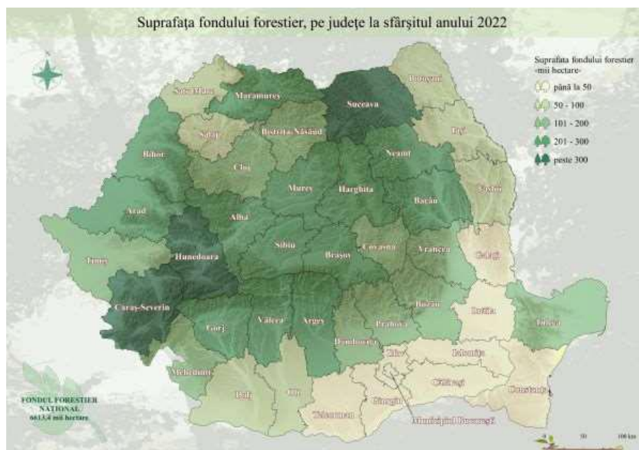
Figura 1. Suprafața fondului forestier pe județe, la sfârșitul anului 2022

La nivel național, în anul 2022, proprietatea publică reprezenta 64,2% din suprafața totală a fondului forestier, fiind administrată în principal de către Regia Națională a Pădurilor – Romsilva, iar proprietatea privată reprezenta 35,8%, fiind administrată în cea mai mare parte de structurile silvice private.