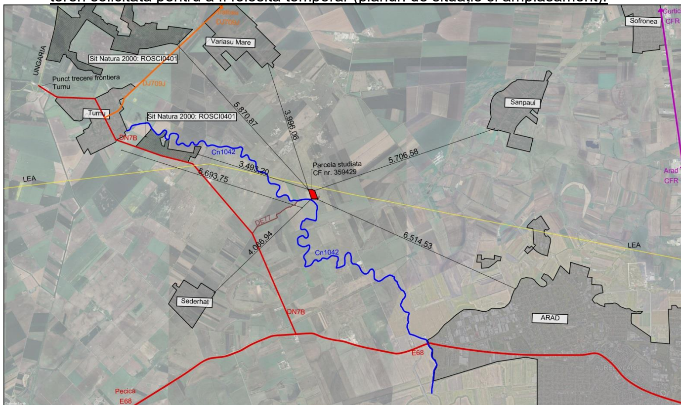
Fig. III.1 Planșă de încadrare cu distanțe până la vecinătăți: intravilane, arii protejate, cu marcarea cailor de transport. Plan suport: Google Earth

e) Planșe reprezentând limitele amplasamentului proiectului, inclusiv orice suprafață de teren solicitată pentru a fi folosită temporar (planuri de situație și amplasament).