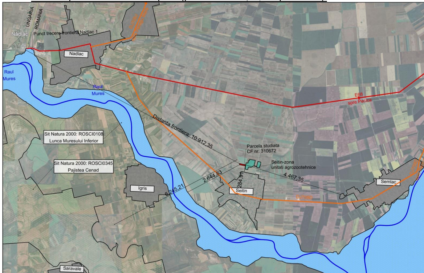
Fig. III.1 Planșă de încadrare cu distanțe până la vecinătăți: intravilane, arii protejate, cu marcarea cailor de transport. Plan suport: Google Earth

e) Planșe reprezentând limitele amplasamentului proiectului, inclusiv orice suprafață de teren solicitată pentru a fi folosită temporar (planuri de situație și amplasament) .