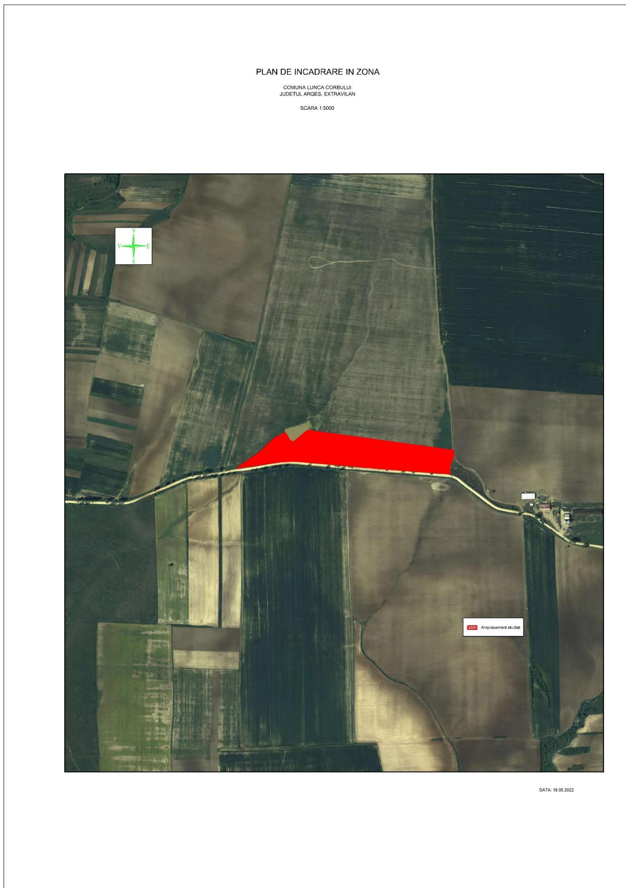
Fig.2. Plan de amplasare in zona