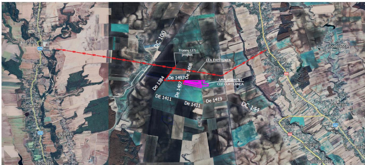
Fig. 1. Zona studiată

ENDLESS SUN POWER SRL planifica sa dezvolte un parc fotovoltaic cu o putere de aproximativ 15 MW (curent alternativ), proiectul consta in instalarea si exploatarea echipamentelor de productie a energiei electrice din surse regenerabile (panouri solare, invertoare, posturi de transformare, etc).