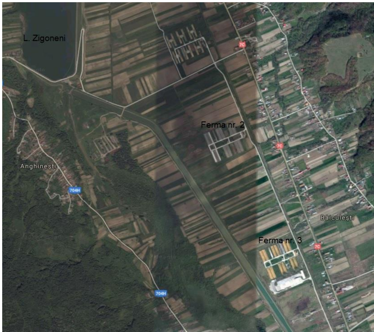
Amplasamentul Fermei nr.2 față de situl ROSPA 0062 – Lacul Zigoneni