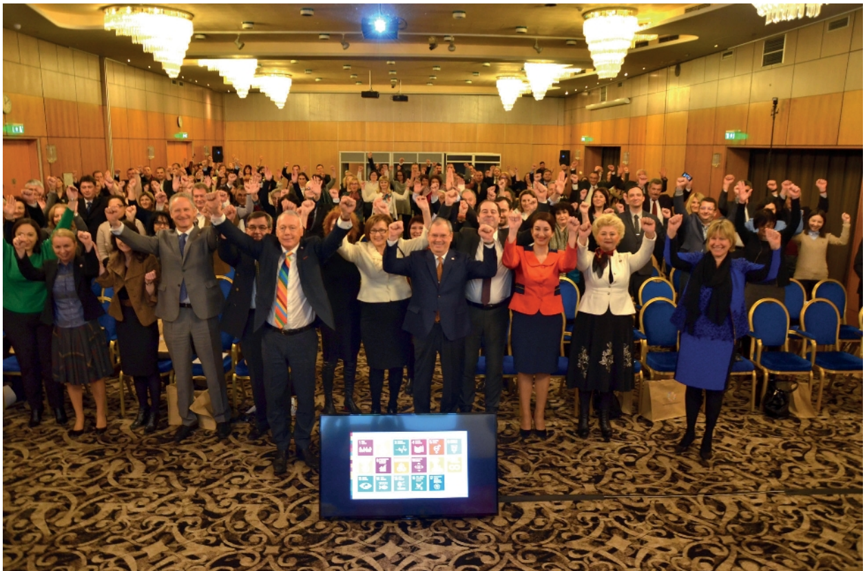
Poza de la evenimentul de lansare a Strategiei Naționale pentru Dezvoltarea Durabilă a României 2030, organizat în 10 decembrie 2018, care a reunit peste 180 de persoane printre care miniștri, parlamentari, ambasadori, dar și reprezentanți distinși din sfera academică, cercetare, mediul privat și societatea civilă.