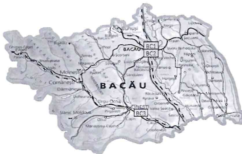
Fig. 1. Amplasarea stațiilor automate de monitorizare care aparțin RNMCA în județul Bacău