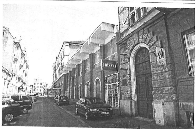
Redacția Crișana s-a mutat pe strada Teatrului nr. 6. Anunțurile de mică publicitate se preiau între orele 09.00-17.30