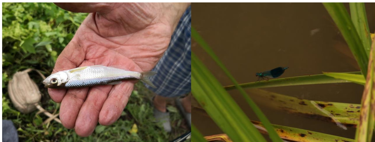
Figură 13 - Indivizi de Alburnus alburnus (stânga) și Calopteryx splendens (dreapta)