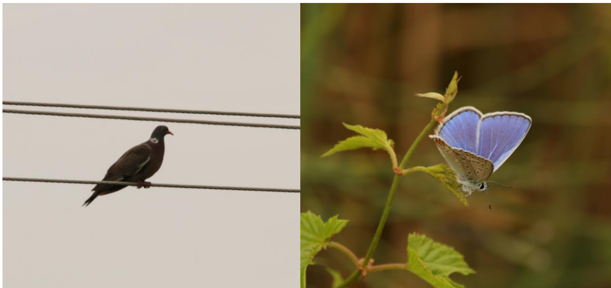
Figură 14 - individ de Columba palumbus (stânga) și Polyommatus icarus (dreapta)