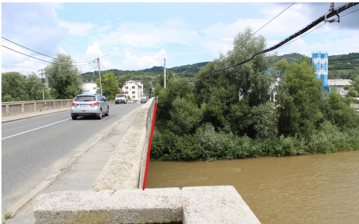
Figură 17 - Localizarea aproximativă a conductei în zona podului peste Someșul Mare Superior (marcaj roșu conducta)