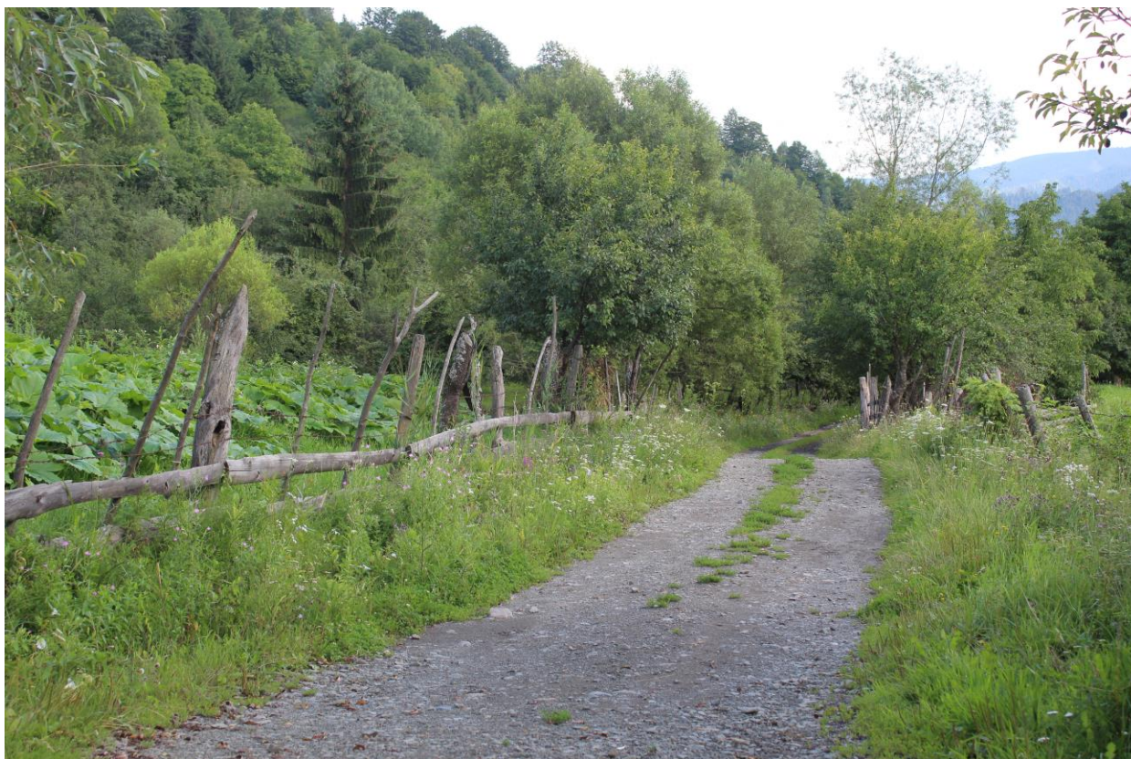
Figură 26 - Aspect din zona localității Bistrița Bârgăului

În urma studiului de teren, s-a semnalat prezența a 14 specii de Lepidoptere (fluturi) în zona în care se vor efectua lucrări, inclusiv specia Neptis sappho (Pallas, 1771) – Fluturile dungat al cununiței, după Rákossy, 2013. Specia este inclusă în Anexa 4B din OUG 57/2007. În România este o specie vulnerabilă - VU, Vulnerable, după Rákossy, Goia & Kovács 2003, iar la nivel european nepercilitată - LC, Least Concern, van Swaay et al. 2010. Asupra celor 14 specii de Lepidoptere (fluturi), impactul se poate considera ușor negativ nesemnificativ prin posibila pierdere a o parte dintre plantele gazdă și a unor ponte în urma lucrărilor efectuate în vegetația aflată de-a lungul drumurilor locale.