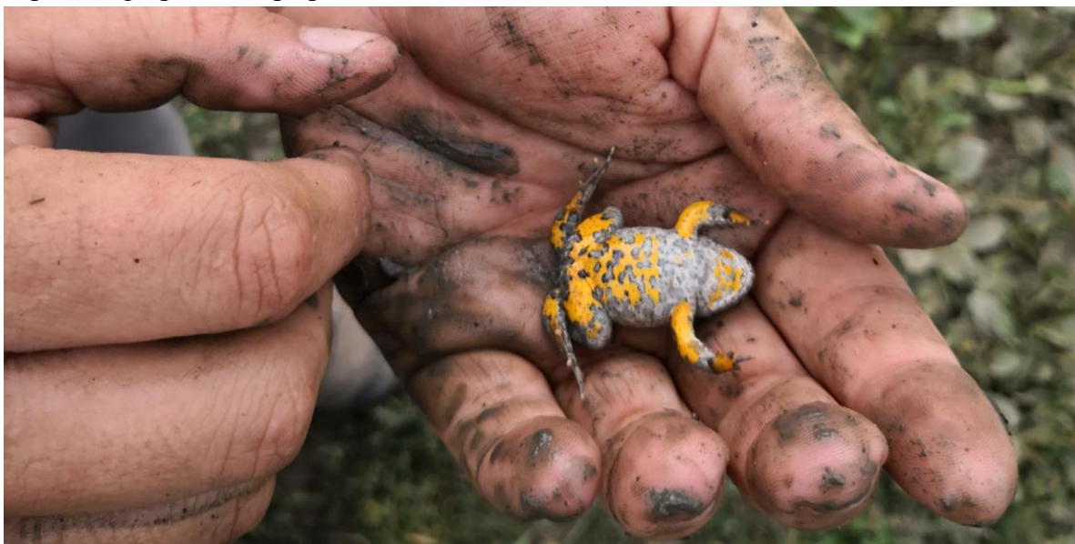
Figură 3 - Individ de Bombina variegata observat într-o baltă de-a lungul drumului RONPA0219 (posibil hibrid cu Bombina bombina )

În România se găsește rasa Bombina variegata variegata . Este o specie permanent acvatică și o întâlnim în orice acumulări de apă, permanente sau temporare, chiar și în bălți poluate sau fără vegetație. Preferă zonele înalte, de deal și submontane, dar o putem găsi și la șes (Iftime, 2005). Preferă bălțile descoperite, iluminate direct de soare. În timpul zilei, plutește la suprafața apei. În caz de pericol se afundă în mâl sau părăsește balta. Pe uscat sau capturată, adoptă o poziție de apărare care simulează moartea, arătându-și și partea ventrală colorată cu pete cenușii-verzui pe fond galben (colorit aposematic). Dorsal, coloritul este cenușiu deschis, brun, măsliniu cu numeroase verucozități cu un spin cornos negru în vârf. Vârful degetelor este galben, iar pupila este cordiformă. În perioada de reproducere, masculul se poate auzi, dar slab deoarece el nu posedă saci vocali. Amplexusul este lombar și este ajutat de calozitățile nuptiale cornoase ale masculului de pe degetele 1, 2 și 3 ale membrelor anterioare, dar și pe membrele posterioare. Intră în apă în aprilie și buhail pot depune 3 ponte pe an, din mai până în septembrie. Ouăle sunt depuse în grupuri mici pe plantele submerse sau în substrat.