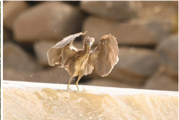
Figură 8 - Indivizi de stârc de noapte - Nycticorax nycticorax (adult stânga și juvenil dreapta)