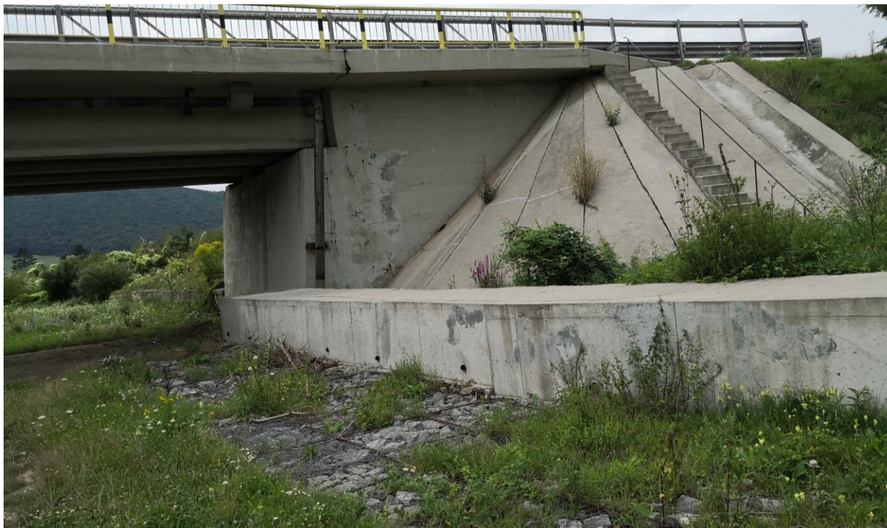
Figură 31 - Aspect de sub pod, din cadrul ROSCI0400 Șieu-Budac