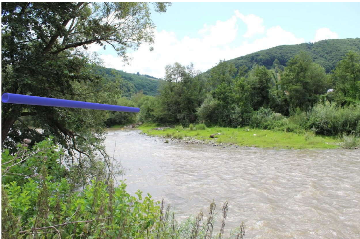
Figură 19 - Localizarea aproximativă proiectată a conductei deasupra cursului de apă (marcată cu albastru)

În urma studiului de teren se semnalează prezența a opt specii de fluturi în zona în care se vor efectua lucrări, dar și a două specii de libelule. Asupra celor opt specii de fluturi, impactul se poate considera negativ redus prin pierderea a o parte dintre plantele gazdă și a unor ponte în urma lucrărilor efectuate în zona. În cadrul populațiilor de Odonate din zona afectată de lucrări, impactul se poate considera neutru – fără impact deoarece lucrările nu afectează structura populației.