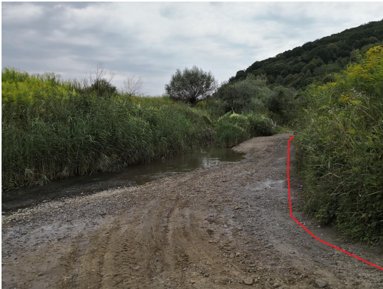
Figură 23 - Localizarea aproximativă a conductei în zona RONPA0219 (marcată cu roșu)

Referitor la nevertebrate, se semnaleză prezenta a patru specii de Lepidoptere în zona în care se vor efectua lucrări, a unei specii din ordinul Odonata dar și a unor Hemiptere (plosnite) din genul Gerris . Asupra celor patru specii de Lepidoptere, impactul se poate considera negativ redus prin posibila pierdere a o parte dintre plantele gazdă și a unor ponte în urma lucrărilor efectuate în zonă. În cadrul populațiilor de Odonate din zona afectată de lucrări, impactul se poate considera neutru – fără impact deoarece lucrările nu afectează structura populației.