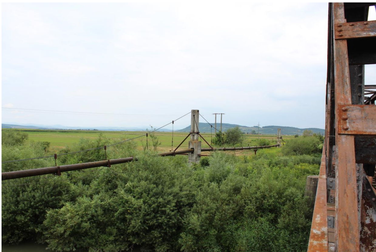
Figură 21 - Reabilitare aducțiune în zona Chirales (amplasamentul 2)

În urma studiilor de teren, se semnaleză prezența a 6 specii de Lepidoptere în zona în care se vor efectua lucrări. Asupra celor 6 specii, impactul se poate considera negativ redus , prin pierderea a o parte dintre plantele gazdă și a unor punte în urma lucrărilor efectuate în zonă.