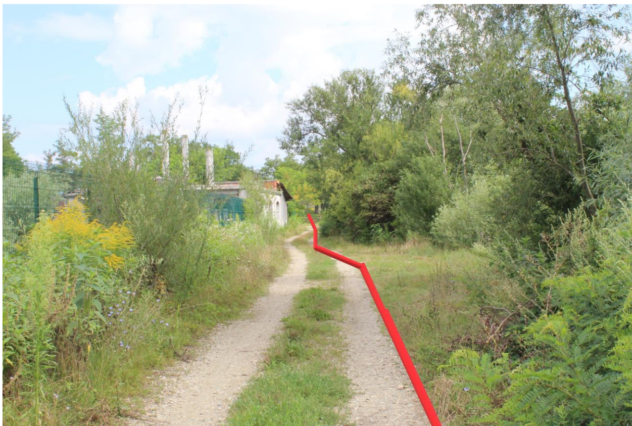
Figură 16 – Localizarea aproximativă a conductei în zona aducțiunii Beclean (marcaj roșu conducta)

La o distanță de aproximativ 20-25 m distanță față de drum, spre cursul Someșului, se află o fâșie de stufăriș și arbori în care s-a observat cuibărirea unei perechi cu pui a stârcului de noapte ( Nycticorax nycticorax ). În plus, au mai fost observate o serie de păsări care utilizează zona din aval de captare și care vor fi afectate pe perioada executării lucrărilor. Este de menționat că în zona, este deja un zgomot de fond din surse antropice, astfel că se poate concluziona că păsările s-au adaptat, sau nu îl sesizează din cauza zgomotului de fond ridicat datorat captării de apă și barajului (ca sursă de zgomot).