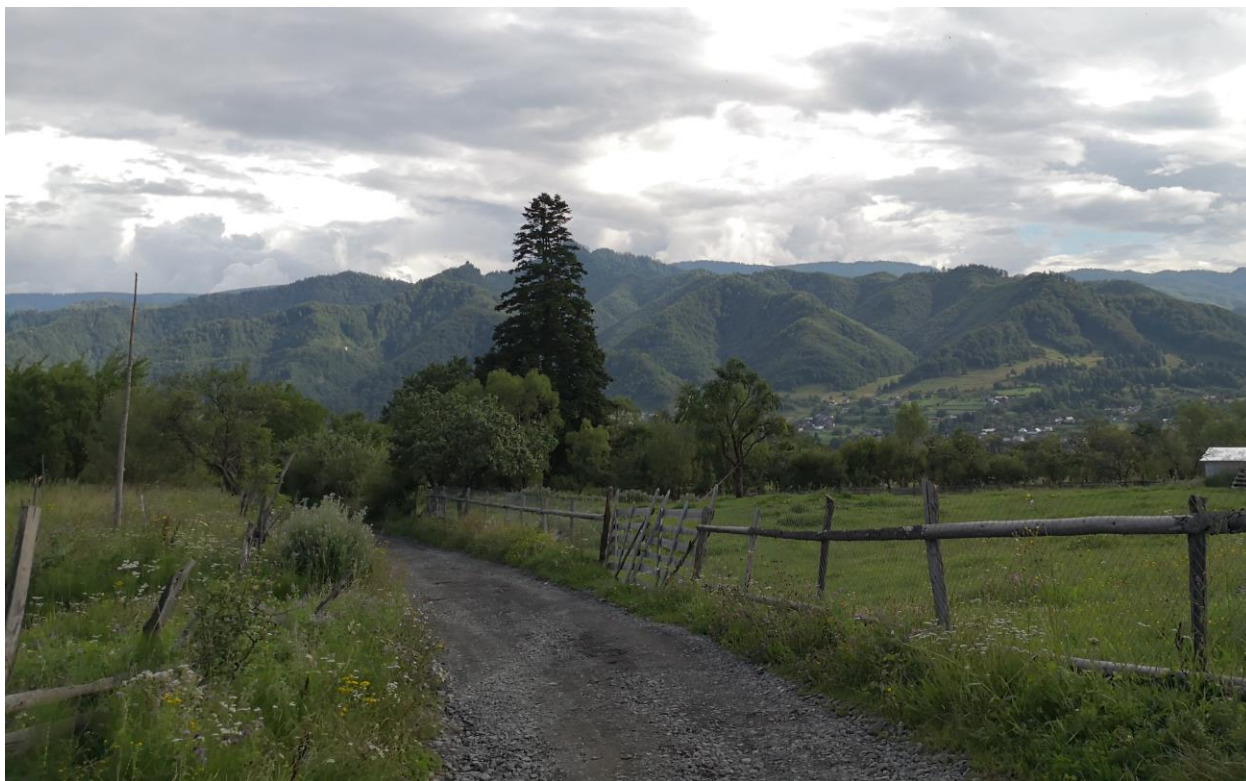
Figură 25 - Aspect din zona localității Bistrița Bârgăului

Neptis sappho – fluturele dungat al cununiței: neutru – fără impact Motacilla alba – codobatură albă: neutru – fără impact Lanius collurio – sfrâncioc roșiatic: neutru – fără impact Phoenicurus ochruros – codroș de munte: neutru – fără impact