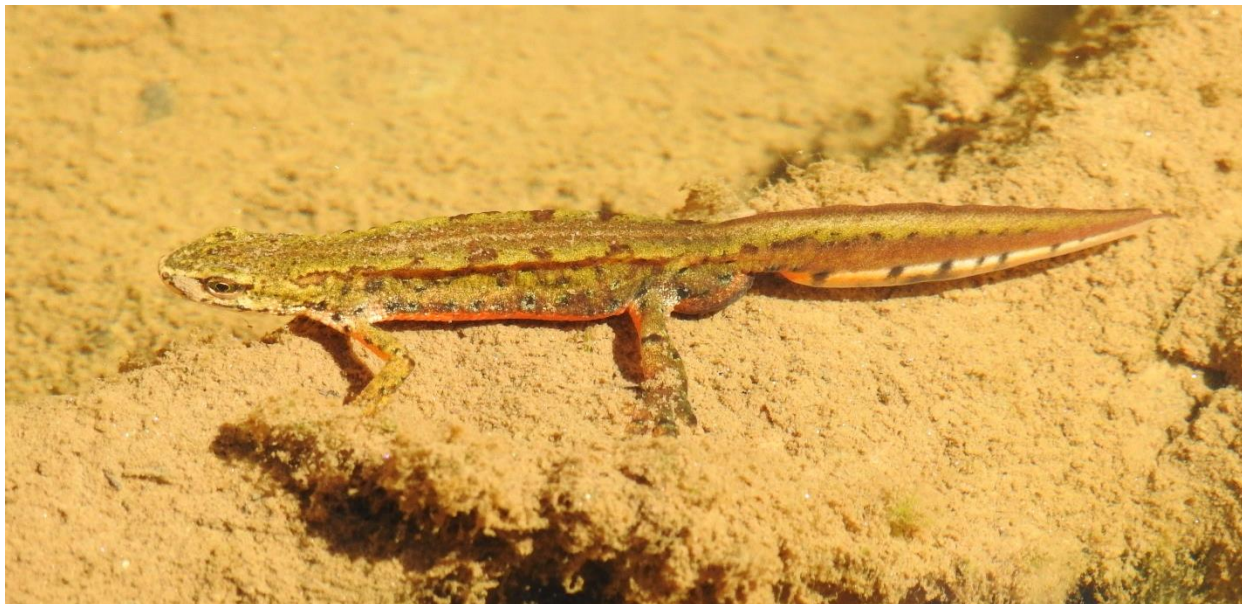
Figură 5 - Masculul de Lissotriton montandoni

Numele speciei este o dedicație pentru naturalistul român de origine franceză Arnold-Lucien Montandon (1852-1922).