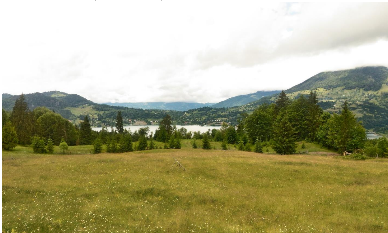
Figură 7 - Aspect din cadrul habitatului, vedere spre Lacul Colibița

Acest tip de habitat cuprinde fânețe montane bogate în specii cu o mare amplitudine ecologică. Sunt cele mai răspândite tipuri de pajiști, fiind prezente în tot lanțul carpatic și ocupă cele mai mari suprafețe. Sunt utilizate atât ca fânețe cât și ca pășuni. Condiții de habitat și factori limitativi: Se întâlnesc atât pe locuri plane cât și pe versanții slab până la moderat înclinați din etajul montan 600 – 1400 m altitudine cu temperaturi medii anuale de 6 - 7°C și precipitații medii de 700 – 1200 mm/an. Solurile sunt slab acide, moderat umede, bogate în substanțe nutritive dezvoltate pe șisturi cristaline și conglomerate.