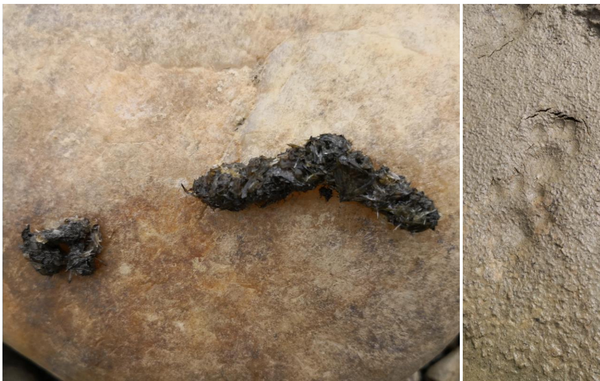
Figură 2 - Semne de prezență a vidrei ( Lutra lutra ) în zona captării Beclean (foto: Neațu Sabin)