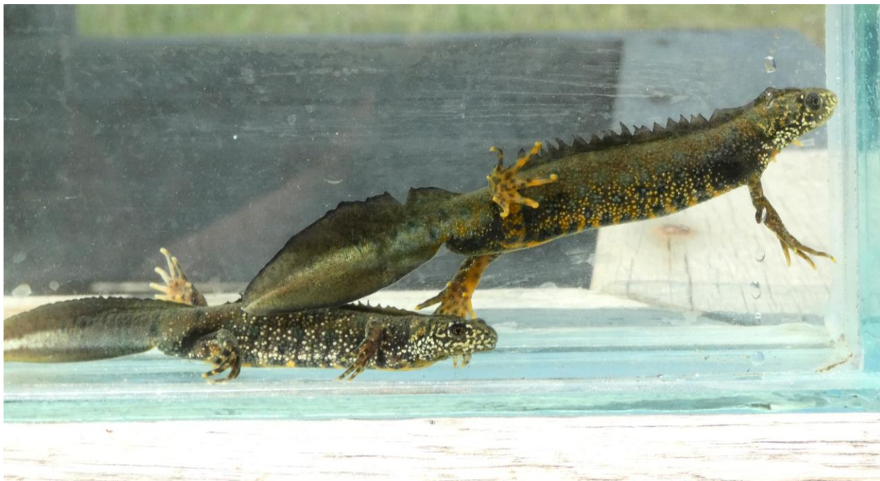
Figura 4 - 2 masculi de Triturus cristatus