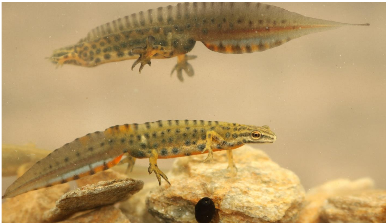
Figură 6 - 2 masculi de Lissotriton vulgaris ampelensis