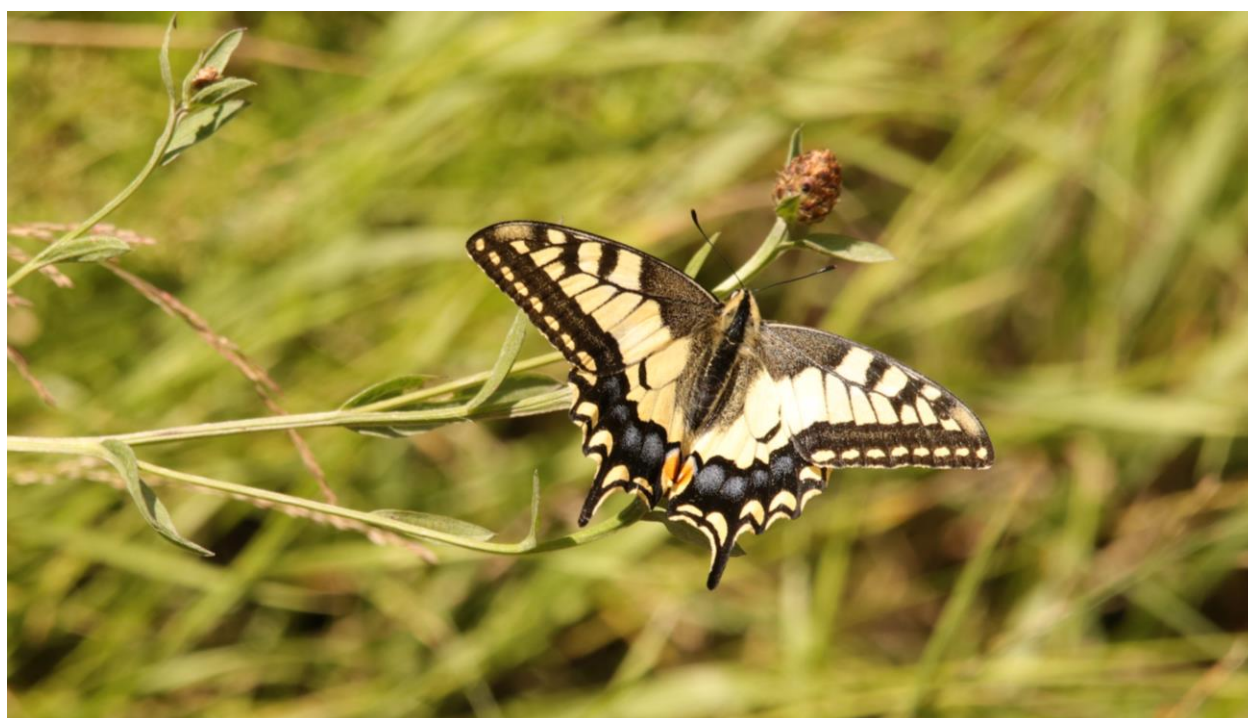
Figură 12 – individ de Papilio machaon