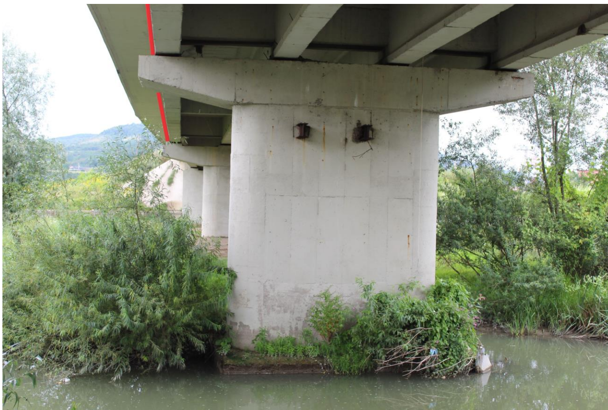
Figură 22 - Localizarea aproximativă a conductei de-a lungul podului Șieu-Măgheruș – marcajul roșu reprezintă traseul conductei

Lutra lutra – vidră: impact negativ redus