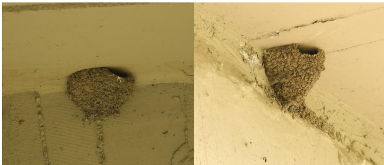
Figură 15 - Cuiburi de Hirundo rustica montate sub pod