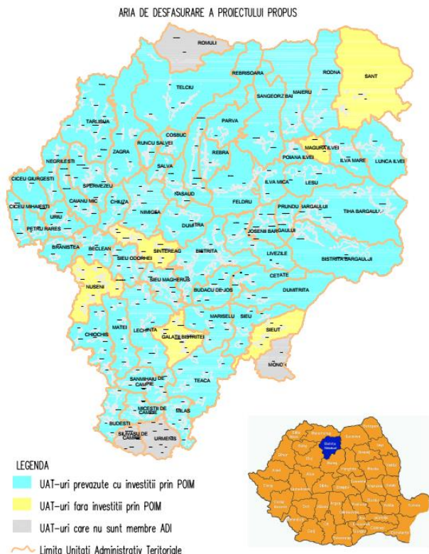
Figura 1 - Aria de desfășurare a proiectului

Investițiile propuse se vor realiza în 134 localități. Aria de implementare a proiectului propus este prezentată în figura de mai jos: