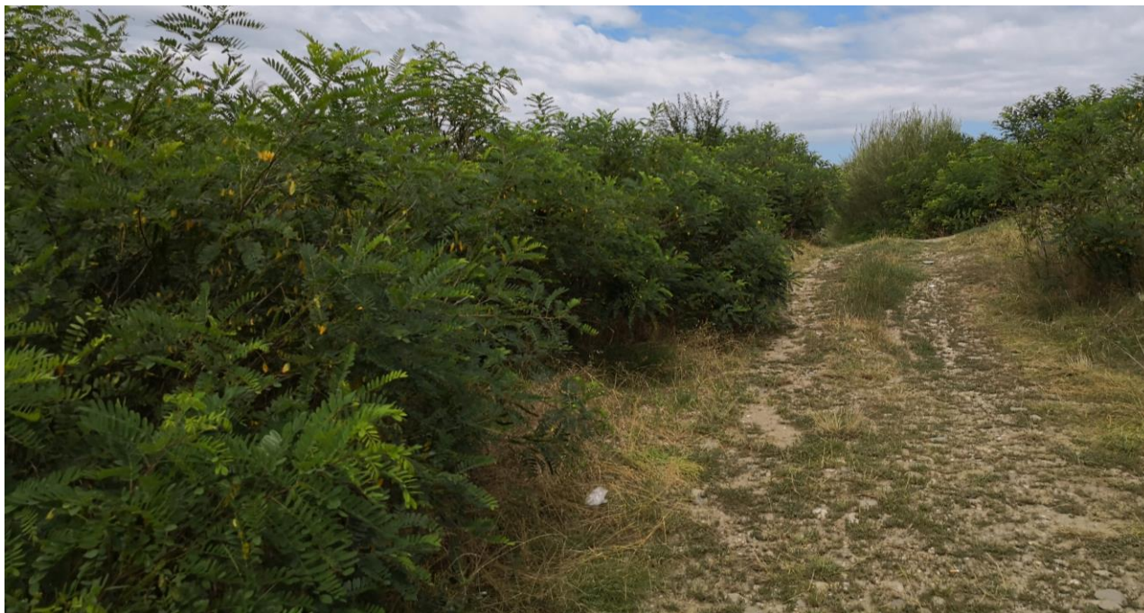
Figură 28 - Aspect cu Amorpha fruticosa din zona captării Beclean