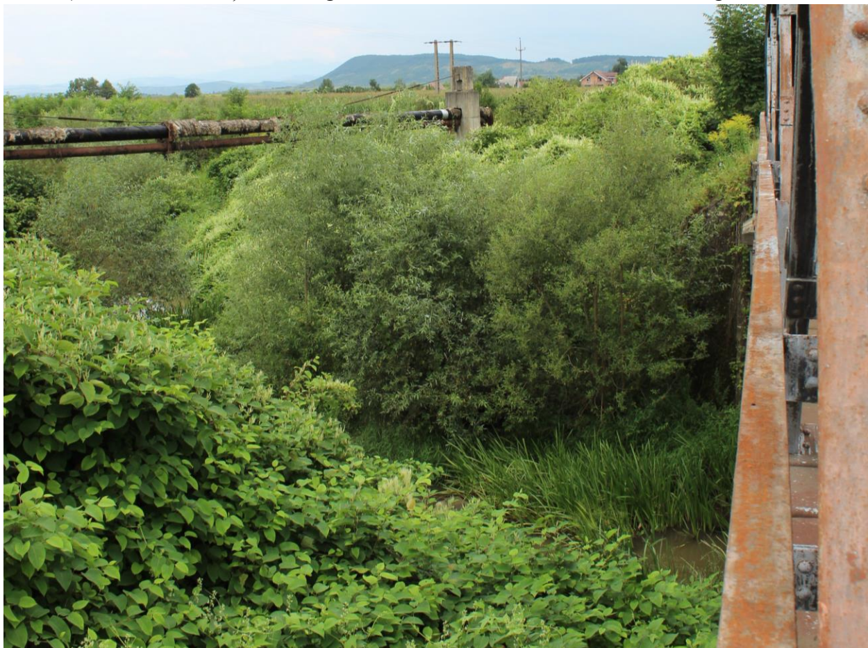
Figură 20 - Reabilitare aducțiune în zona Chirales (amplasament 1)

Impactul negativ redus asupra ariei naturale protejate se va resimți doar în perioada de realizare a lucrărilor și va consta în surse noi de zgomot și de noxe/pulberi. Este de menționat că sursele noi de zgomot vor avea un efect adăugat față de traversarea căii ferate de către trenuri. Astfel, în cazul în care există populații de vidră în cele 2 locații (deși nu au fost identificate în cadrul ieșirii în teren), acestea sunt obișnuite cu zgomotul, trenurile traversând calea ferată regulat.