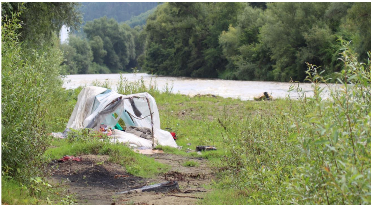
Figură 29 - Aspect din teren în zona suprapunerii proiectului cu ROSCI0232 Someșul Mare Superior