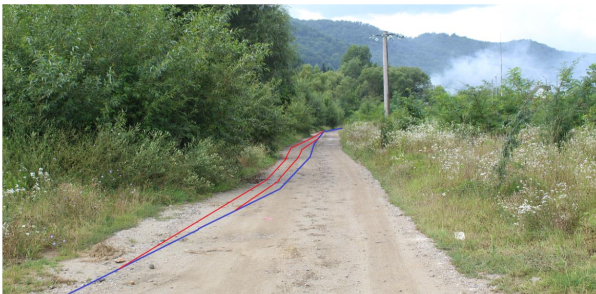
Figură 18 - Localizarea conductei în zona străzii Dumitru Vârtic (marcaj albastru – limită sit, marcaj roșu – conducte)

Lutra lutra – vidră: neutru – fără impact