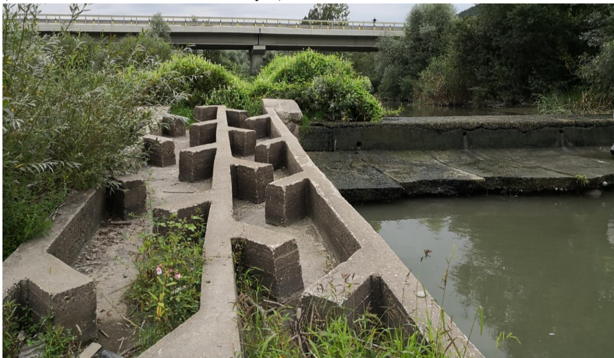
Figură 30 - Scara de pești nefuncțională și podul rutier în plan secund

Cum s-a amintit și în subcapitolul anterior, zona este antropizată, betonată și conține un prag de fund dezafectat cu o scară de pești înfundată și nefuncțională. În acest sens, cel mai probabil, impactul cel mai mare nu este datorat lucrărilor propuse, ci de barierele antropice amintite, mai ales în cazul speciilor de pești, care nu pot migra în amonte, ci doar în aval și în anumite condiții (debit de apă crescut). Inclusiv vidra este afectată, astfel că ea va trebui să părăsească apă ca să traverseze (în cazul în care există în zonă) fiind mai susceptibilă atacurilor câinilor hoinari. De asemenea, cursul apei și malurile sunt brăzdate de deșeuri, cele mai multe de plastic. Impactul proiectului va putea cumula și cu traficul rutier al podului, dar și în acest caz, speciile eventuale care apar aici sunt obișnuite cu prezența omului și a deranjului pe care îl poate provoca (ex: cuiburile de rândunică montate sub pod).