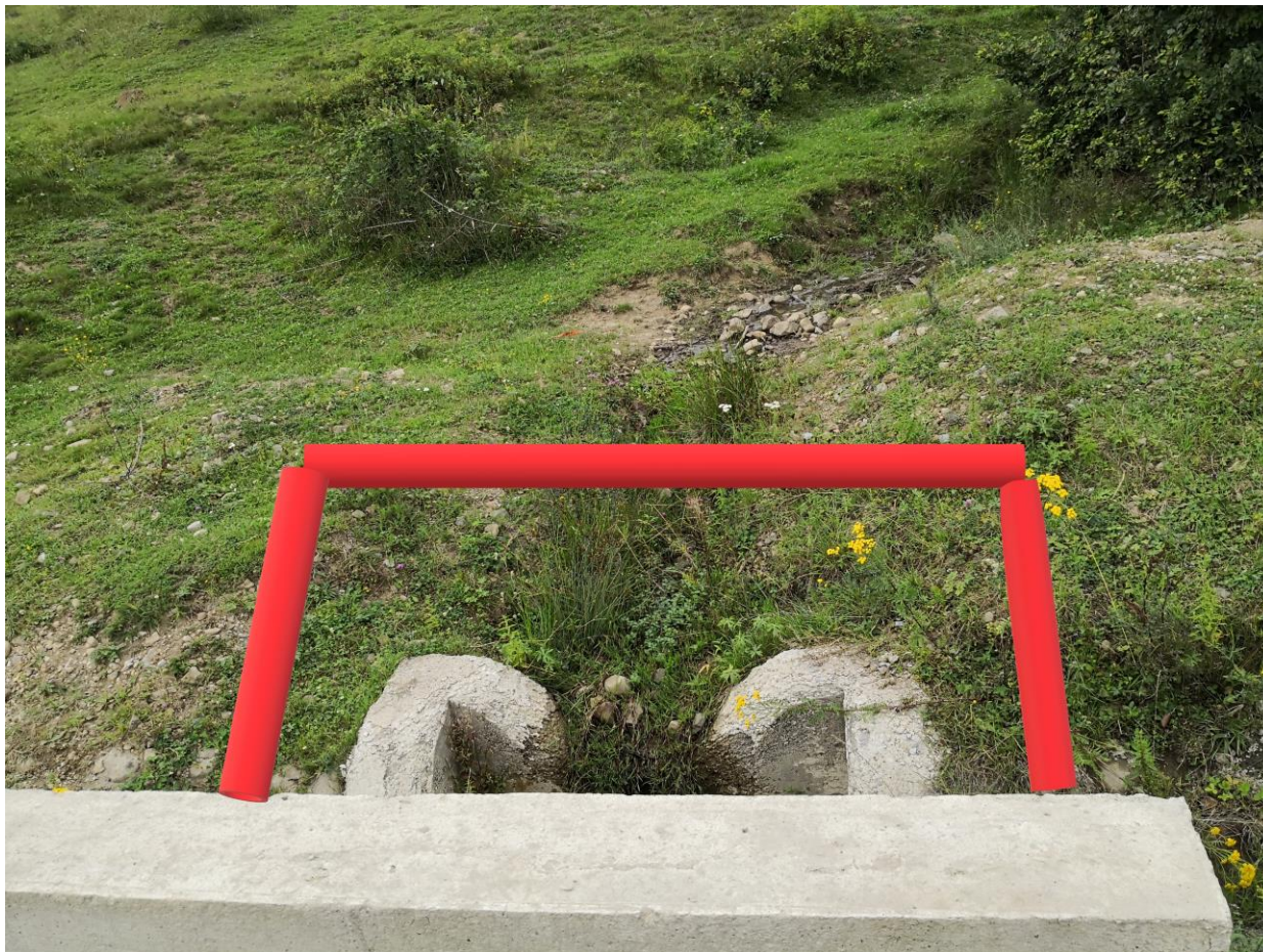
Figură 27 - Zona de subtraversare a izvorului în habitat potențial al buhaiului de baltă ( Bombina variegata ) – marcaj roșu – conducta

Analiza bazei de date a ROSCI0051 Cușma a fost făcută cu o oarecare rezervă, din cauza timpului destul de mare scurs de la realizarea studiilor de inventariere și evaluare a stării de conservare. Astfel, planul de management a fost aprobat în anul 2016, dar studiile s-au finalizat în august 2015, astfel că în 3-4 ani, sunt șanse relativ mari să existe modificări în distribuția speciilor sau a habitatului.