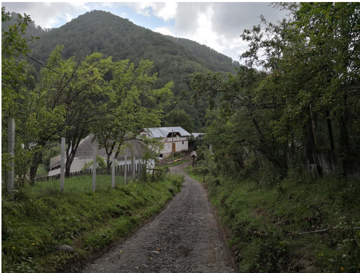
Figură 24 - Aspect din cadrul localității Bistrița Bârgăului, în zona de proiect

deranjul creat de oameni (doar în perioada de execuție a lucrărilor) și doar de-a lungul străzilor, pe o distanță față de aceasta de 10-20 m.