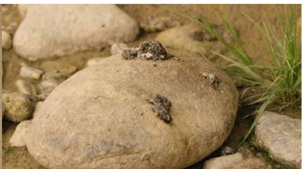
Figură 10 - Indivizi de Mergus merganser (stânga) și urme de vidră (dreapta)