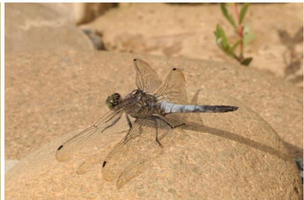
Figură 9 - Indivizi de Sympetrum sanguineum (stânga) și Orthetrum calcellatum (dreapta)