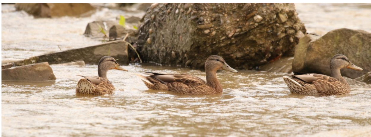
Figură 11 - Rață mare ( Anas platyrhynchos ) observată în proximitatea străzii Dumitru Vârtic