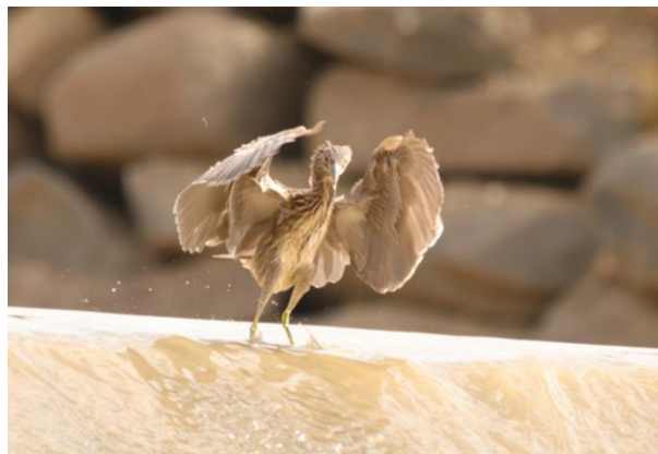
Figură 8 - Indivizi de stârc de noapte - Nycticorax nycticorax (adult stânga și juvenil dreapta)