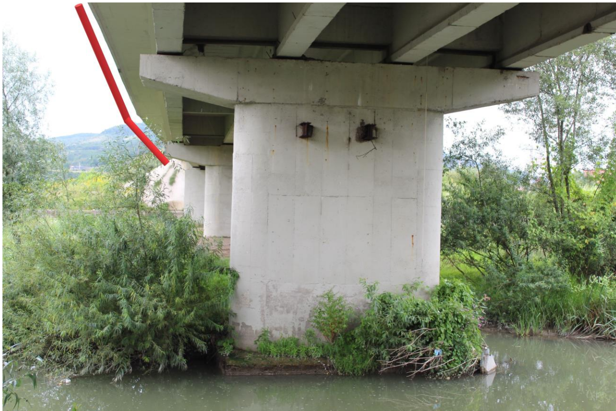
Figură 22 - Localizarea aproximativă a conductei de-a lungul podului Șieu-Măgheruș – marcajul roșu reprezintă traseul conductei

Lutra lutra – vidră: impact negativ redus