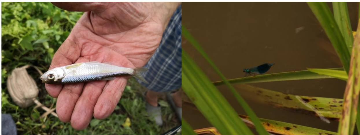
Figură 13 - Indivizi de Alburnus alburnus (stânga) și Calopteryx splendens (dreapta)