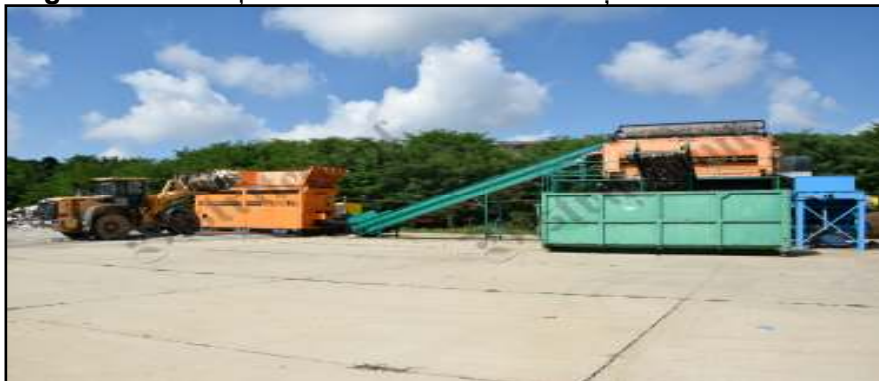
Figura 2 Instalația de tratare mecanică a deșeurilor

Deșeurile menajere amestecate din zonele urbane de blocuri și deseuri reciclabile colectate selectiv sunt descărcate pe platforma betonată, de unde, după îndepărtarea manuală a deșeurilor voluminoase (anvelope, scaune, navete), a celor feroase mari, cartonului curat sunt încărcate în tocător cu ajutorul unui încărcător frontal .