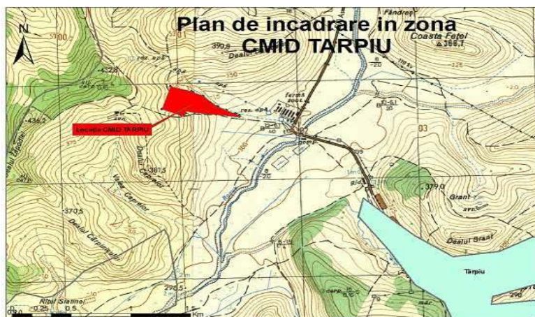
Figura 1 Plan de încadrare în zonă a locației CMID Târgu

Vecinătatea CMID: proprietăți particulare.