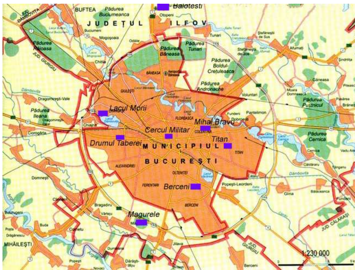
Amplasarea stațiilor de monitorizare

Prezentăm mai jos evoluția indicelui general pentru calitatea aerului din rețeaua locală de monitorizare a calității aerului