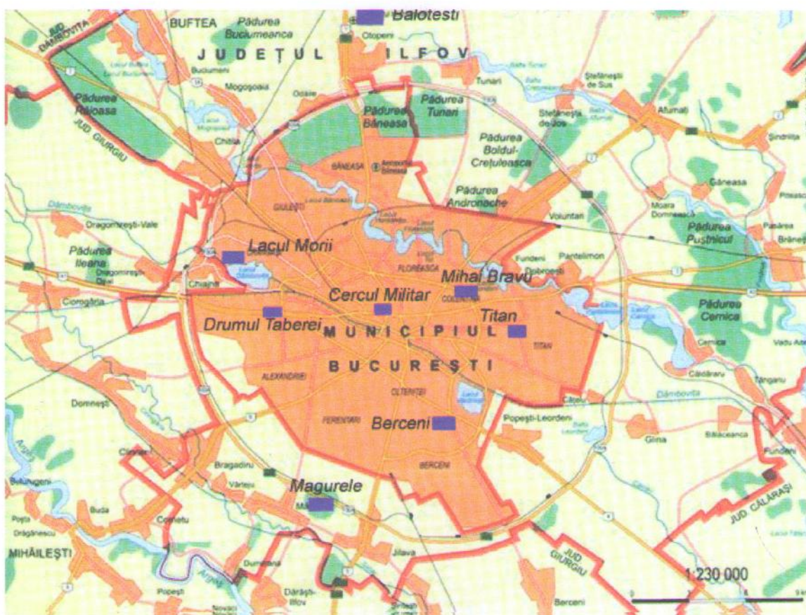
Amplasarea stațiilor de monitorizare

Prezentăm mai jos evoluția indicelui general pentru calitatea aerului din rețeaua locală de monitorizare a calității aerului