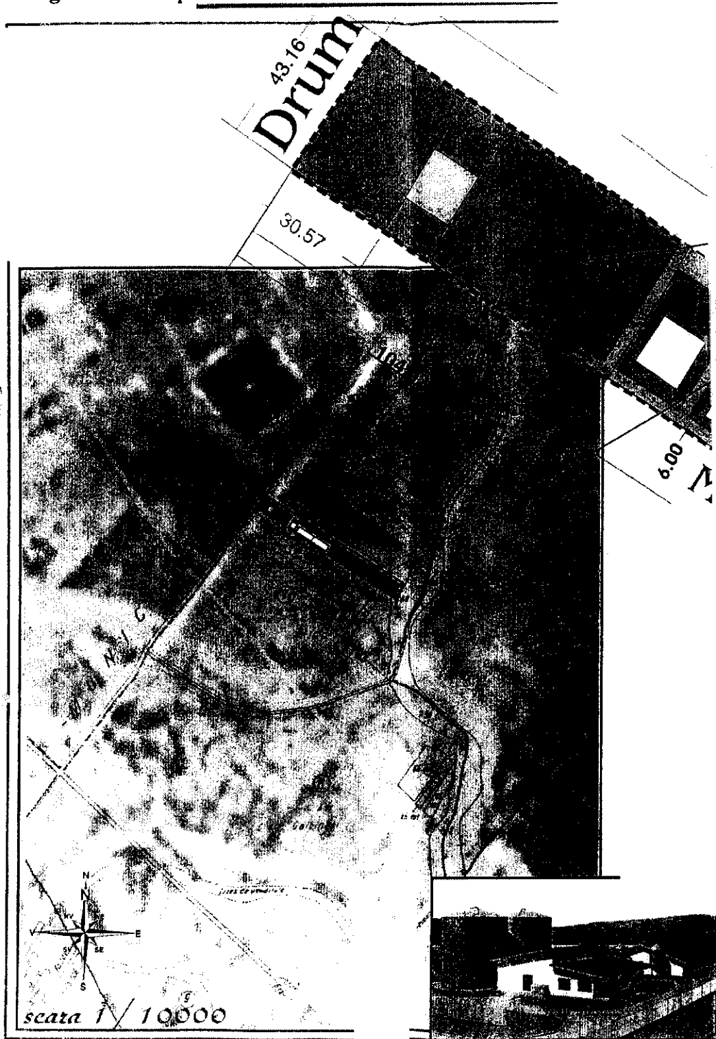
Fig. 1.a. Plan amplasament