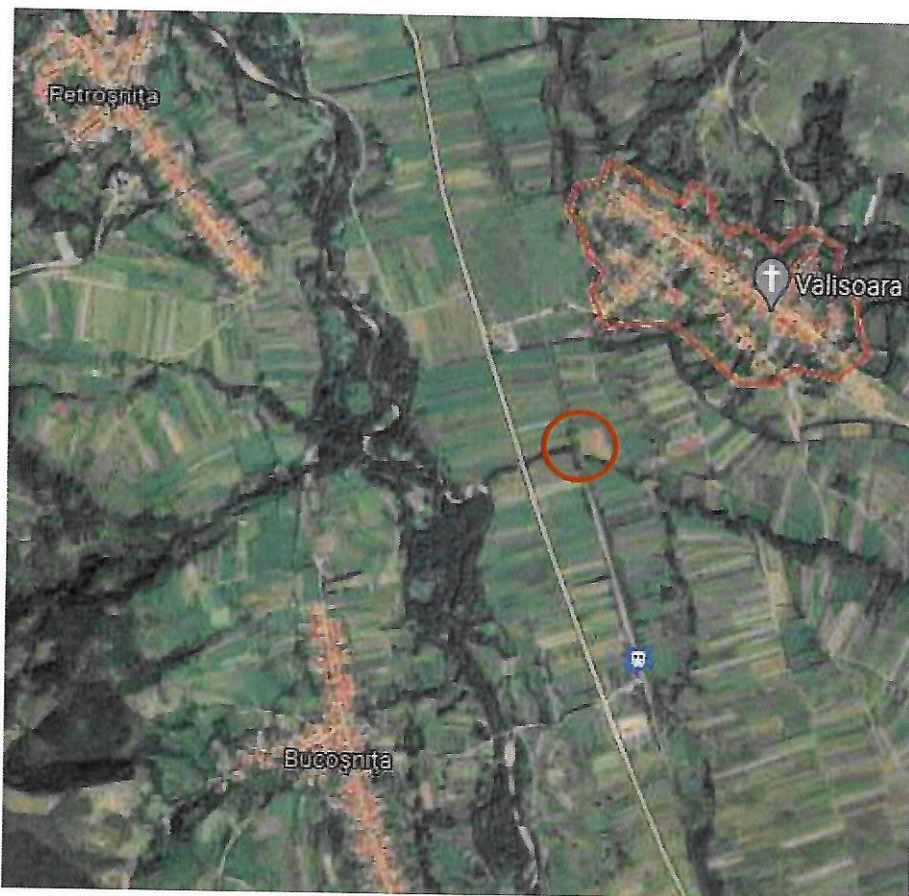
Fig. 1 – Amplasament lucrări proiectate - pod CF km 462+081

Podul de cale ferată se află la km 462+081 linia 100 Orșova-Jimbolia, în imediata vecinătate a localității Vălișoara (Comuna Bucușnița), județ Caraș-Severin și traversează oblic pârâul Groapa Copaciului, afluent a râului Timiș.