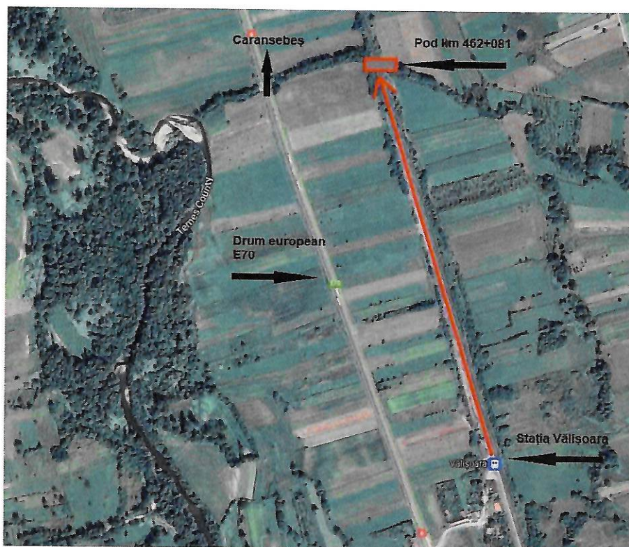
Fig. 2– Amplasamentul obiectivului în relație cu stația Vălișoara

– lucrările, dotările și măsurile pentru protecția așezărilor umane și a obiectivelor protejate și/sau de interes public - NU ESTE CAZUL