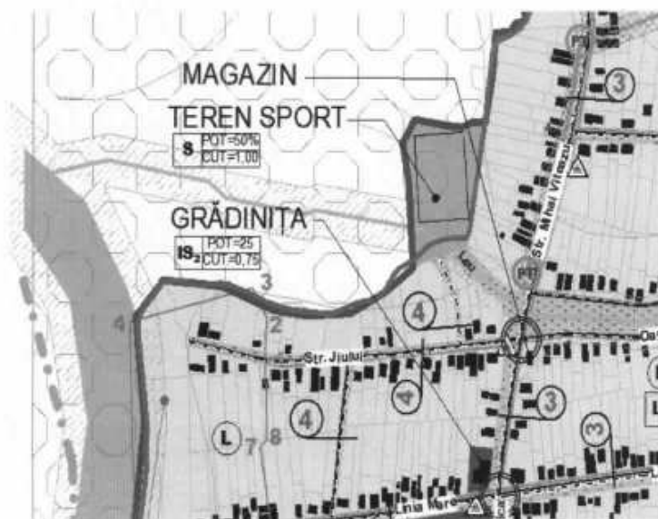
Plan cu situatie Existenta / Propus P.U.G. 2023

Din acesti 14,75% , doar 0,13% se suprapun cu intravilanul in plansa cu SITUATIA EXISTENTA si plansa REGLEMENTARI PUG 2023 a satului SECUI - un teren de sport cu o suprafata de 0,93 Ha care nu isi modifica functiunea . Pentru aceasta zona nu exista alte proiecte in derulare.