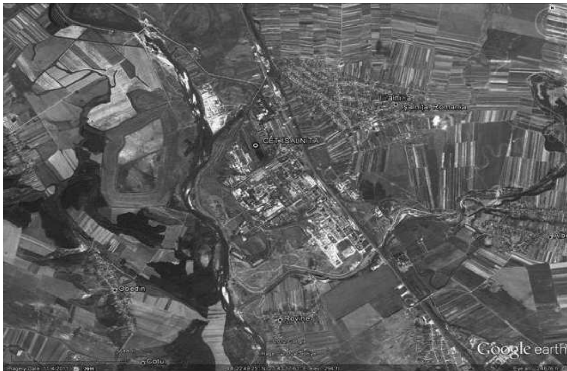
Figura 1 Vedere din satelit – Amplasamentul CET ISALNITA

S CEO – Sucursala Electrocentrale Isalnita se afla în zonă industrială la distanța de 2 km față de așezările umane.