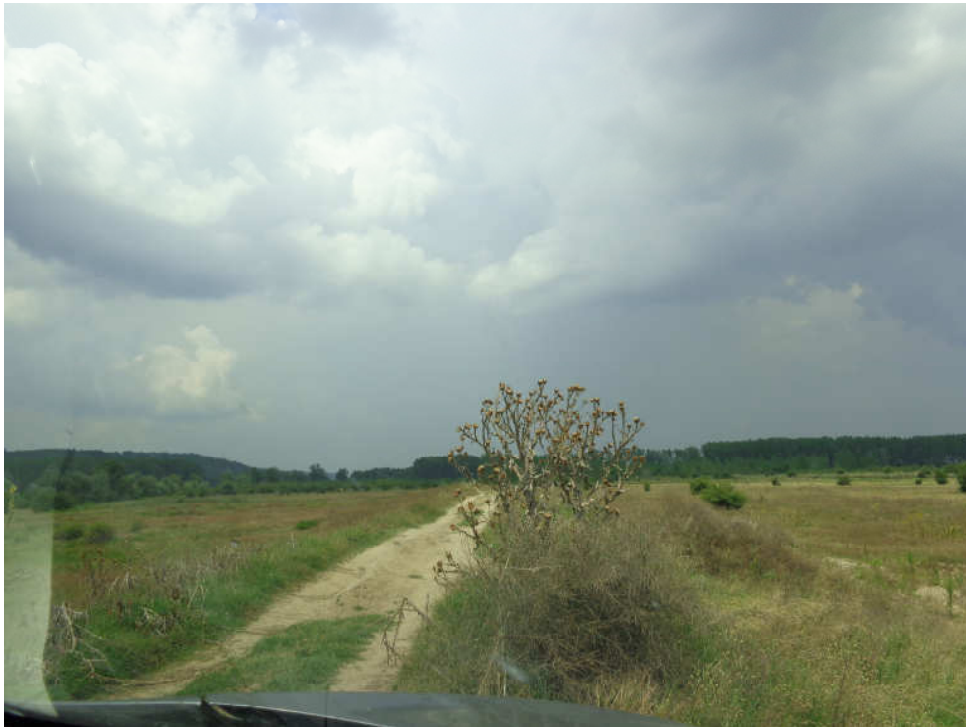
Figura 2-Drum acces la perimetru