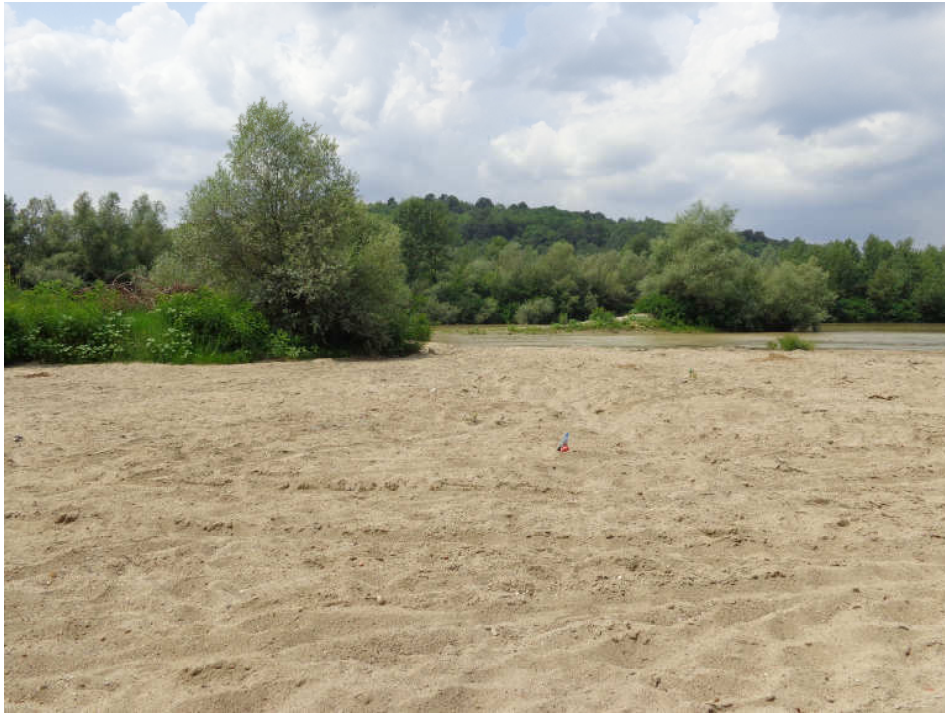
Figura 1- Vedere generala