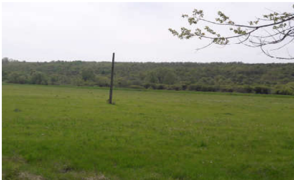
Fig. 2 – Amplasament statie de epurare - foto