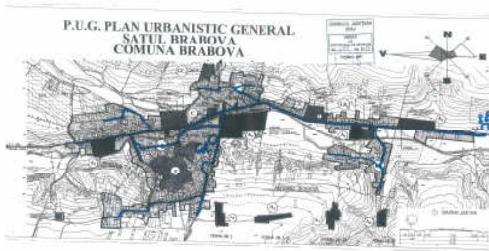
Fig. 1 - Extras din PUG