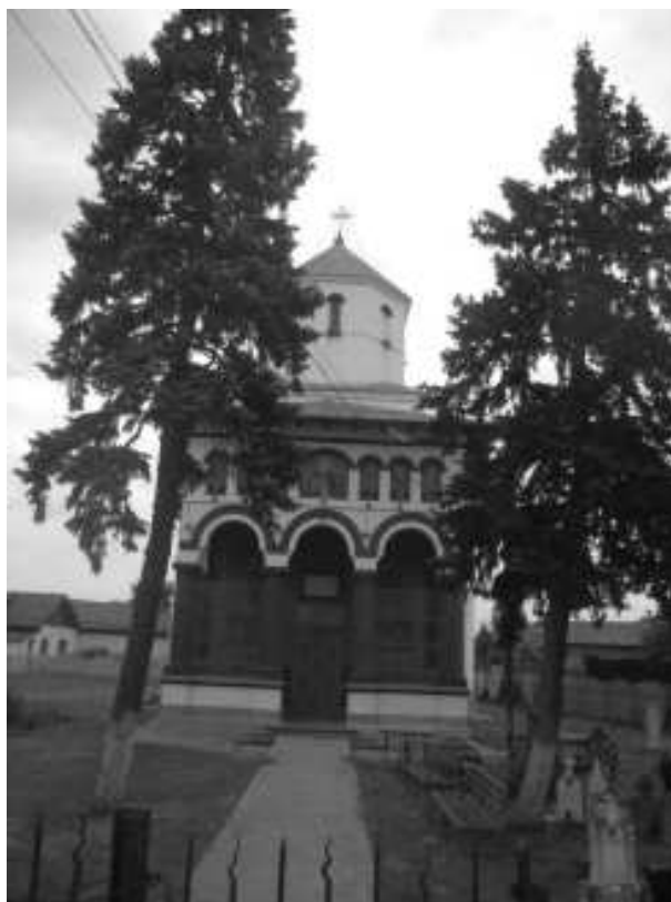
pozitia nr. 552, cod monument istoric DJ-II-m-B-08342 – biserica Sf. Grigore Decapolitul , 1817, refacuta 1914 - situata in satul Podari