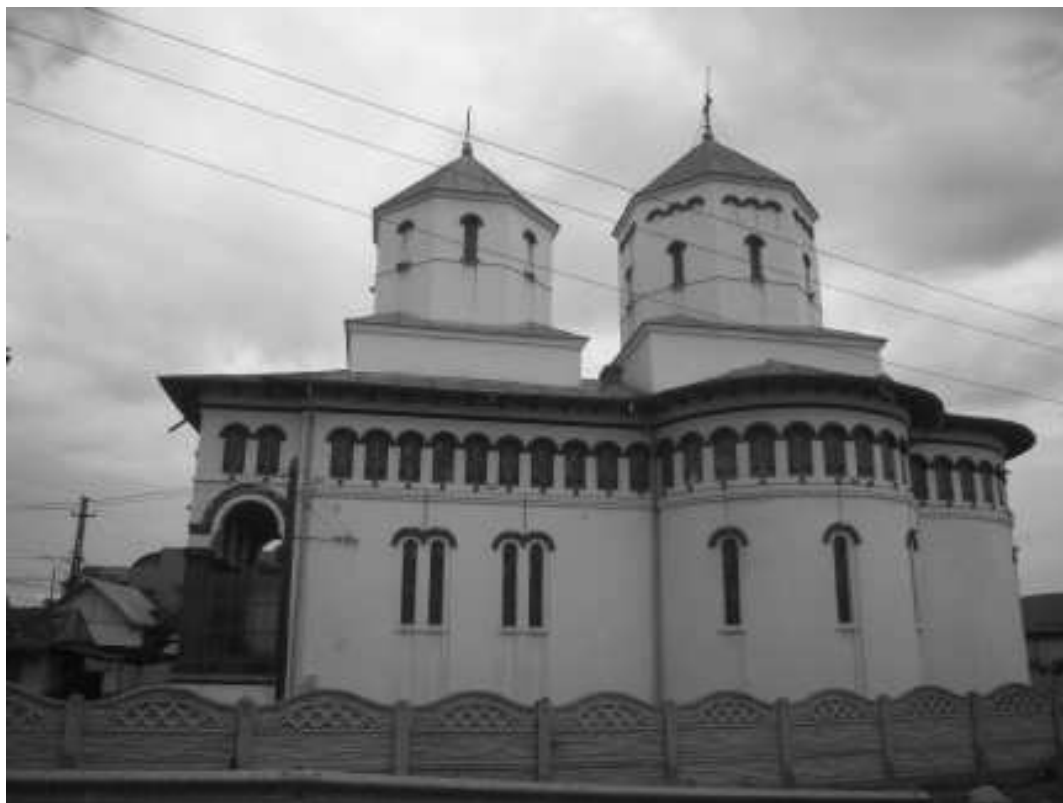
pozitia nr. 552, cod monument istoric DJ-II-m-B-08342 – biserica Sf. Grigore Decapolitul , 1817, refacuta 1914 - situata in satul Podari