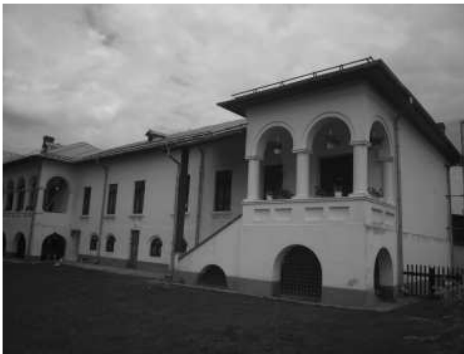
pozitia nr. 398, cod monument istoric DJ-II-a-A-08203.03 – chilii – inc. sec XX, pe ruinele caselor vechi - situate in satul Braniste – manastirea Jitianu