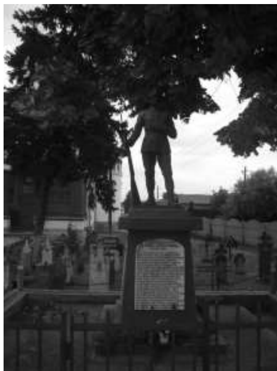
pozitia nr. 552, cod monument istoric DJ-II-m-B-08342 – biserica Sf. Grigore Decapolitul , 1817, refacuta 1914 - situata in satul Podari – monumental eroilor