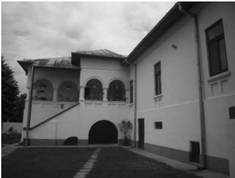
pozitia nr. 397, cod monument istoric DJ-II-m-A-08203.02 – staretie – 1956; pe ruine de sec. XVII – situata in satul Braniste – manastirea Jitianu