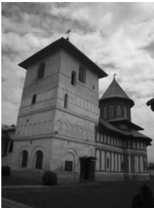
pozitia nr. 399, cod monument istoric DJ-II-a-A-08203.04 – turn clopotnita – sec XVIII – situat in satul Braniste – manastirea Jitianu