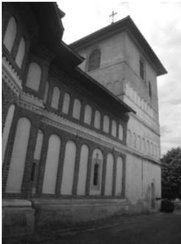
pozitia nr. 399, cod monument istoric DJ-II-a-A-08203.04 – turn clopotnita – sec XVIII – situat in satul Braniste – manastirea Jitianu