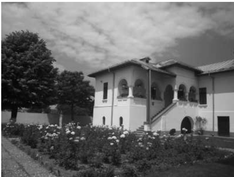
pozitia nr. 397, cod monument istoric DJ-II-m-A-08203.02 – staretie – 1956; pe ruine de sec. XVII – situata in satul Braniste – manastirea Jitianu