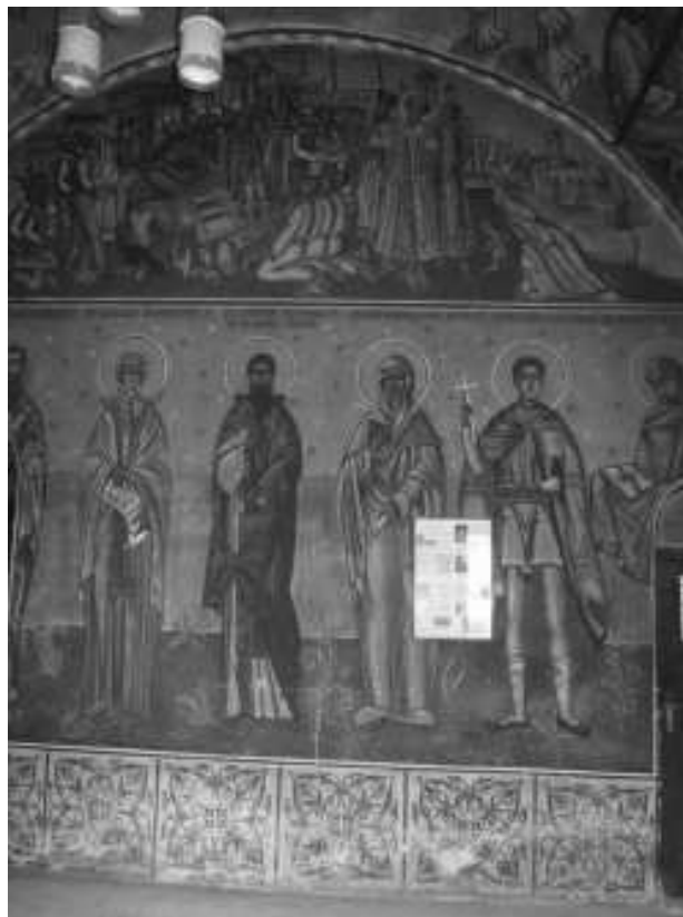
Fresca in biserica Sf. Dumitru – 1656 – 1658 - situata in satul Braniste – manastirea Jitianu – autor pictorul Costache Petrescu ( 1852)