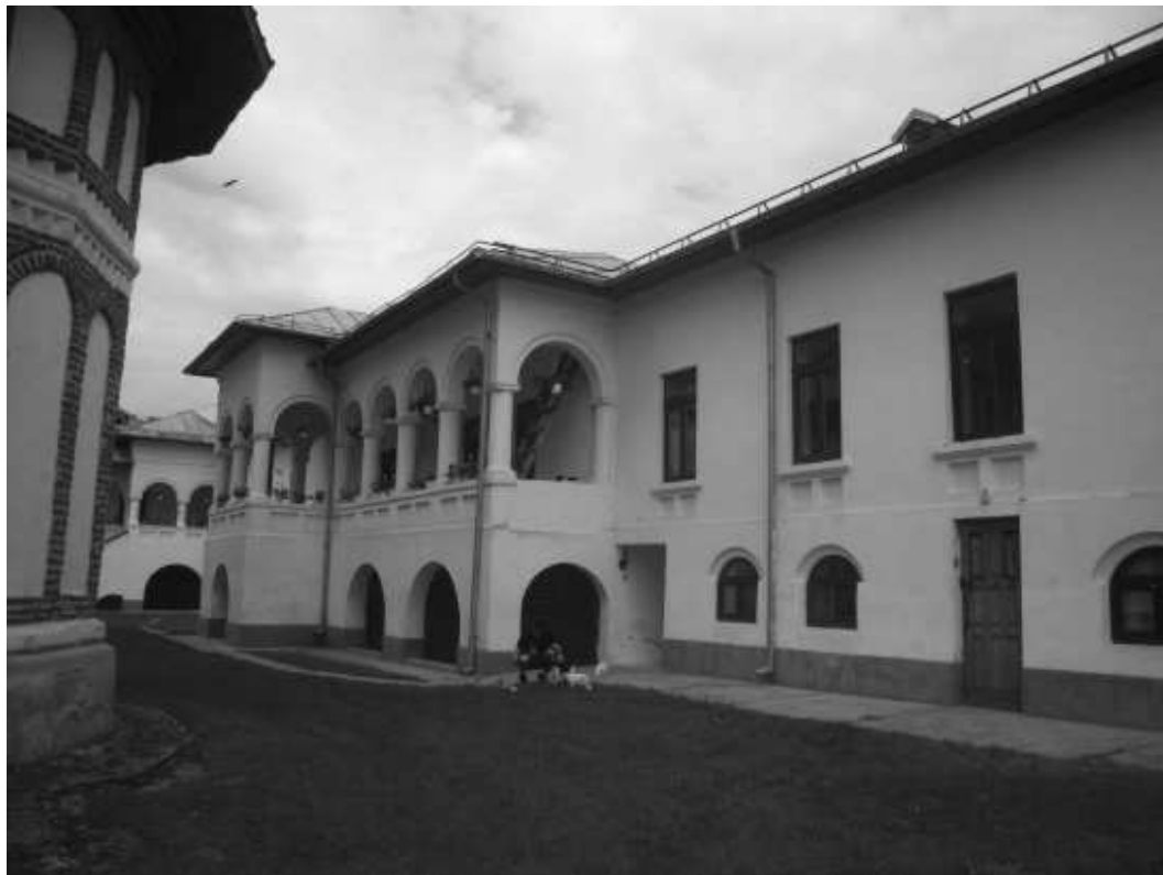
pozitia nr. 398, cod monument istoric DJ-II-a-A-08203.03 – chilii – inc. sec XX, pe ruinele caselor vechi - situate in satul Braniste – manastirea Jitianu