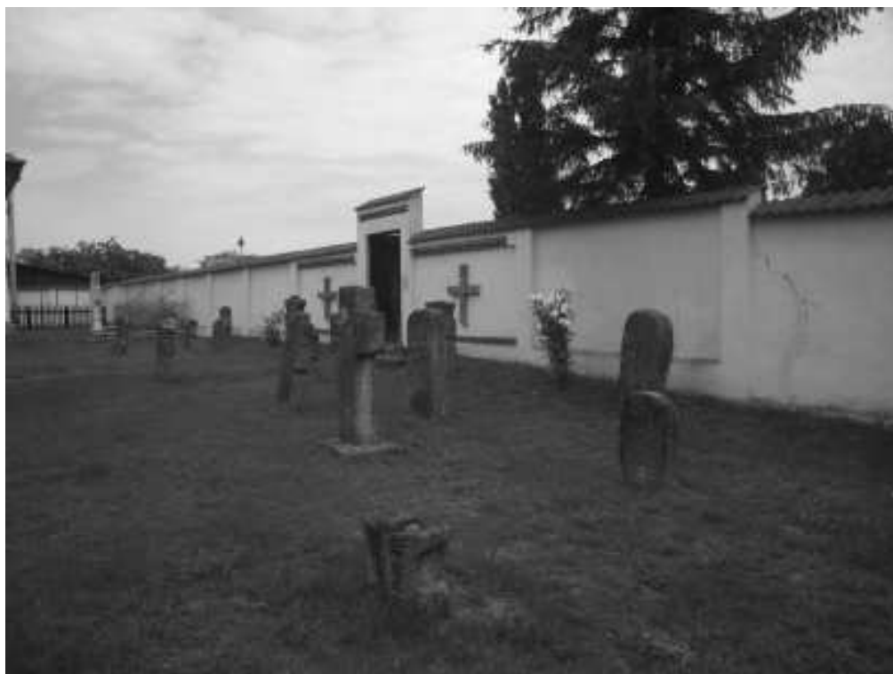
Manastirea Jitianu – cimitirul din incinta