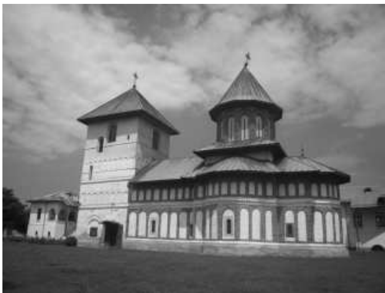
pozitia nr. 396, cod monument istoric DJ-II-m-A-08203.01 – biserica Sf. Dumitru – 1656 – 1658 - situata in satul Braniste – manastirea Jitianu