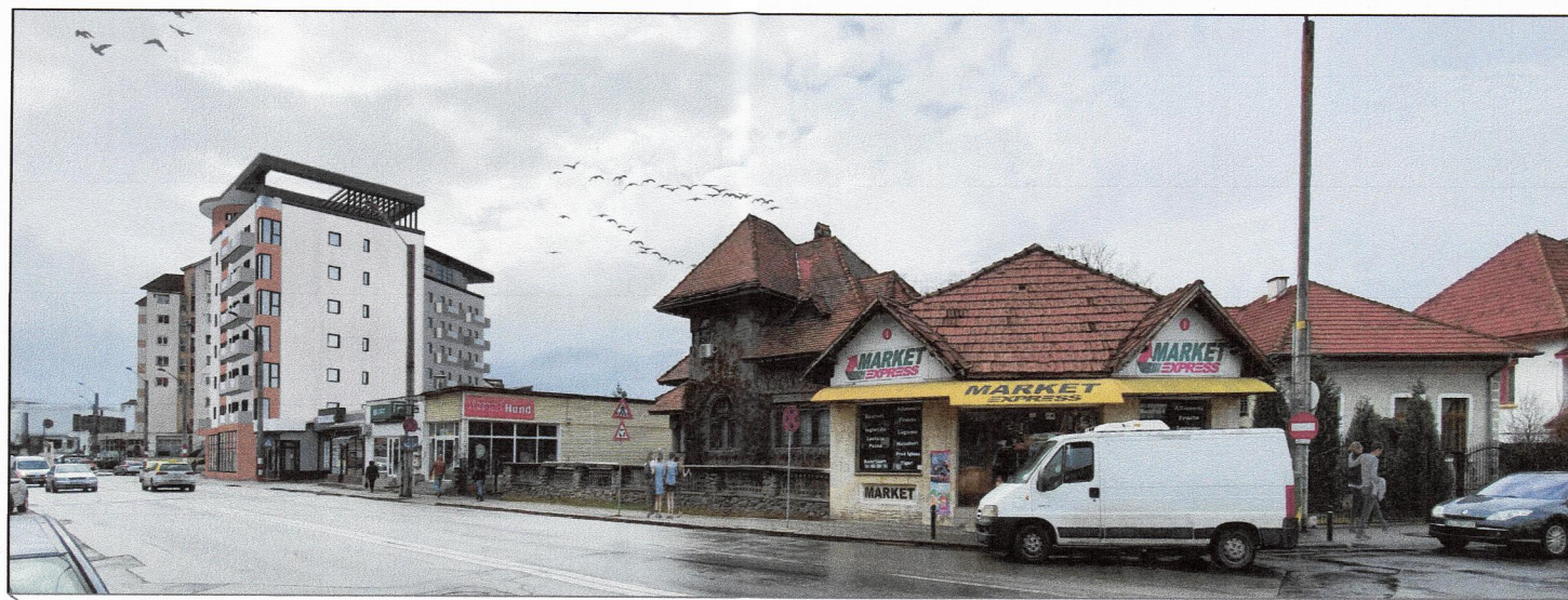
VEDERE DIN PUNCTUL 1 - PROPUNERE