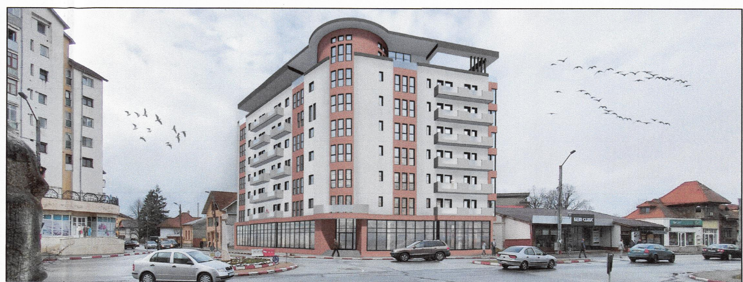
VEDERE DIN PUNCTUL 2 - PROPUNERE