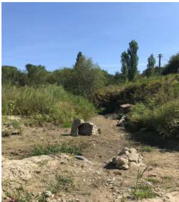
Fotografie din albia paraului Oreavu in zona I

Zona II de interes este caracterizata prin maluri inalte, abrupte si o deschidere mai mare a albiei minore ce permite curgerea libera a apei.