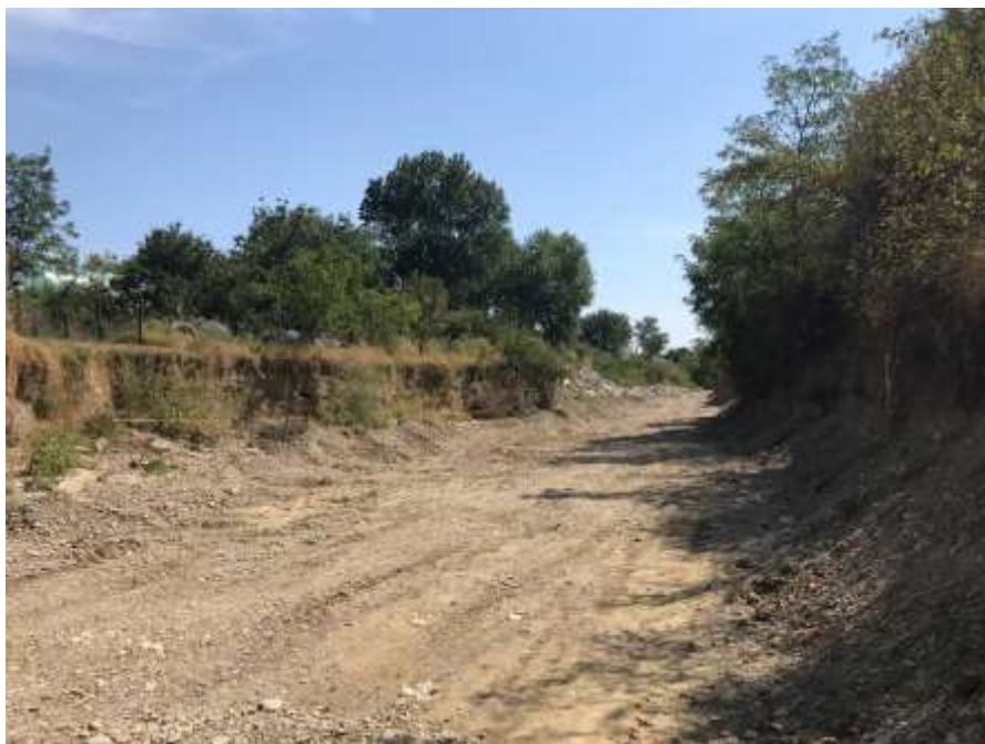
Fotografie din albia paraului Oreavu in zona II

Zona II de interes este caracterizata prin maluri inalte, abrupte si o deschidere mai mare a albiei minore ce permite curgerea libera a apei.