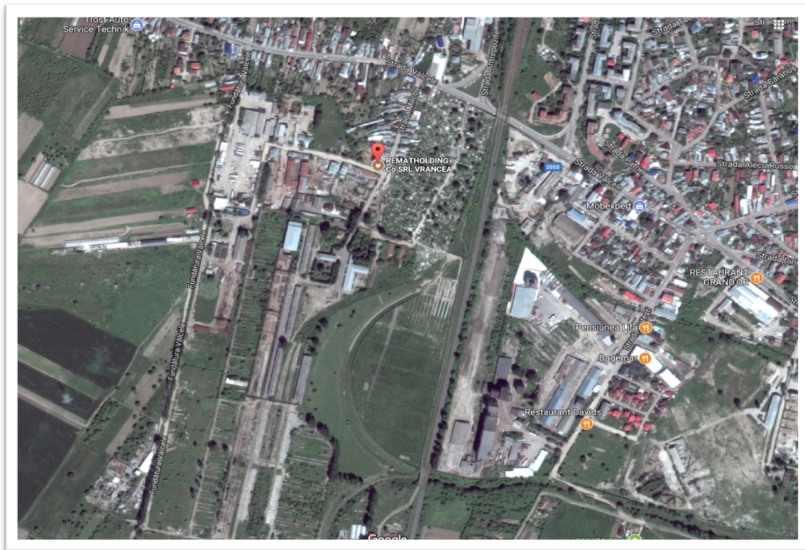
Fig. Nr. 1 – Plan de incadrare in zona

Incadrarea in zona a amplasamentului obiectivului este prezentata in figura de mai jos.