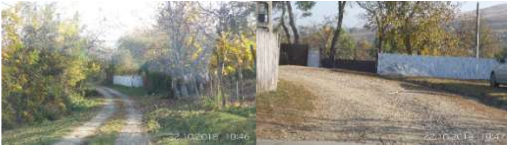
Foto 01. Situatia existenta a strazilor