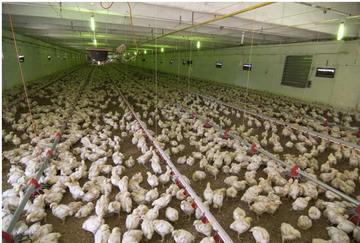
Hală de păsări

S.C. AVICOLA FOCȘANI S.A. funcționează 365 zile/an, în 5,8 – 6 cicluri a câte 40 - 42 zile și practică exclusiv tehnologia de creștere a păsărilor la sol, pe pat de creștere format din rumeguș, paie, talaș sau coji de floarea-soarelui.