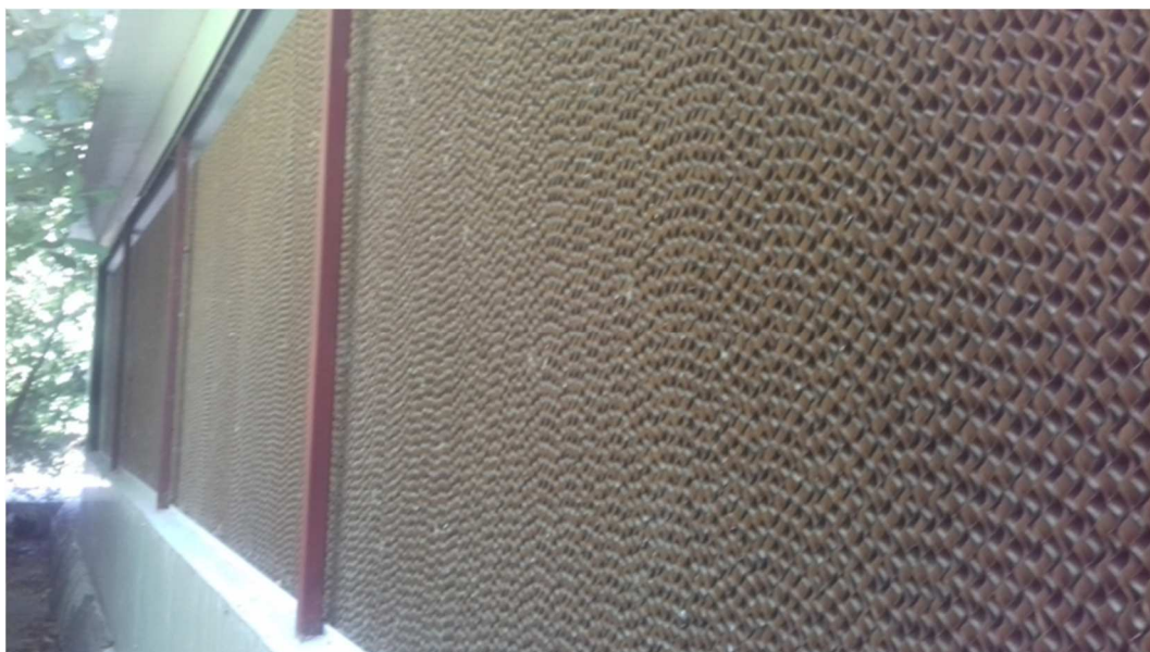
Figura nr. 12. Dispozitiv de răcire a aerului tip CELDEK-7060

funcționează în sistem închis cu recircularea permanentă a apei, fiind dotat cu o pompa de recirculare și un bazin de stocare pentru apa de completare. Aerul care asigură ventilația în hale trece prin aceste panouri, este răcit de apa recirculată și apoi pătrunde în hale. Se asigură astfel o răcire de la 38° C la temperatura optimă de 27° C și o creștere a umidității de la 30% , la 74 % pentru a crea un climat favorabil pasărilor. Debitul de apă necesar sistemului de răcire este de 1,11 mc/h. Aceste dispozitive funcționează 1-2 ore/zi la amiaza, când temperatura în hale crește foarte mult, timp de 90-150 zile /an prin rotație și nu simultan pentru cele 32 de hale. Ele intra în funcțiune doar la creșterea exagerată a temperaturii, în funcție de nr. de capete, vârsta păsărilor și de umiditatea din interior.