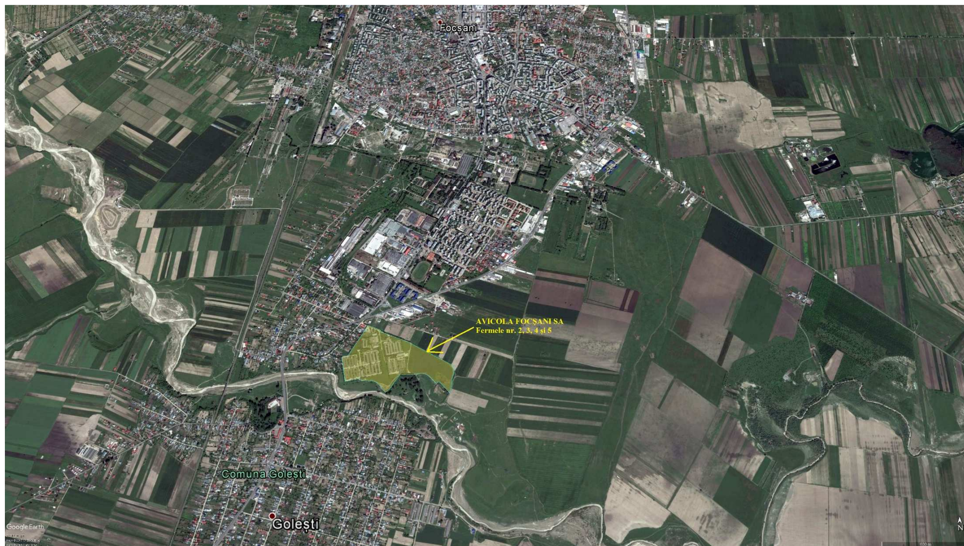
Localizare AVICOLA FOCȘANI SA – Fermele nr. 2, 3, 4 și 5 Golești