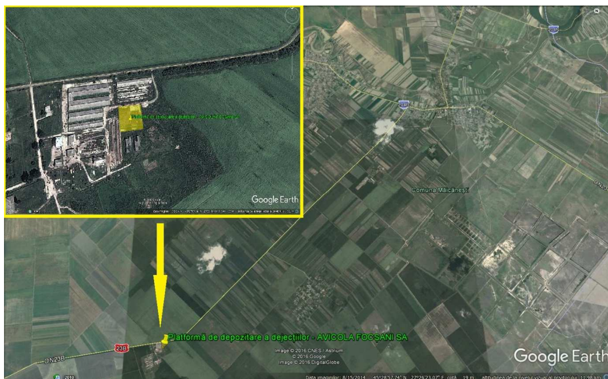
Localizarea platformei de stocare a dejecțiilor

AVICOLA FOCȘANI SA desfășoară în cadrul amplasamentului denumit „Ferma de pasări – pui de carne” activitatea de creștere intensivă a păsărilor de carne folosind tehnologia de creștere la sol pe așternut permanent de resturi vegetale (paie,