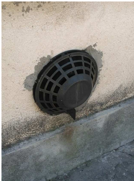
Dispozitiv de eliminare a gazelor arse

Convectoarele sunt dotate cu dispozitive de eliminare a gazelor arse, fiecare având câte un element terminal (pălărie) montat pe peretele exterior, la nivelul la care este montat convectorele.