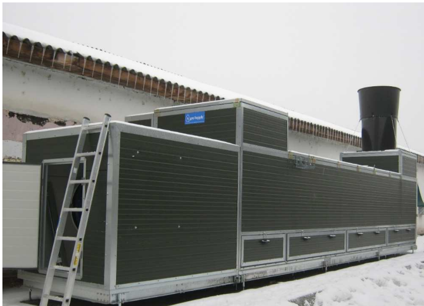
Recuperatorul de căldură

Schimbătorul de căldură folosește aerul cald din interiorul halei pentru a încălzi aerul proaspăt din exterior. Schimbătorul de căldură are o eficiență termică ridicată, de aproximativ 80%, întregul proces fiind asistat de calculator.