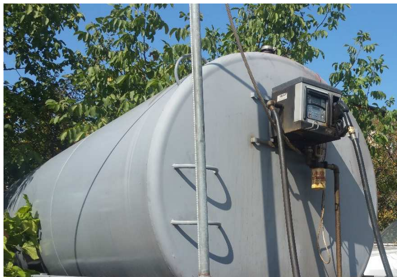
Rezervorul de motorină (capacitate 14.600 l)