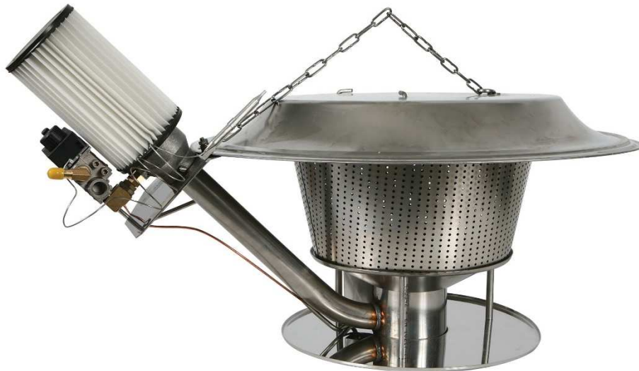
Încălzitor de tip Gasolec G12

Hala C51 din cadrul fermei nr. 2 este echipată, suplimentar, cu un schimbător de căldură Agro Supply tip ACM for broiler houses 1.0-1.5 m.