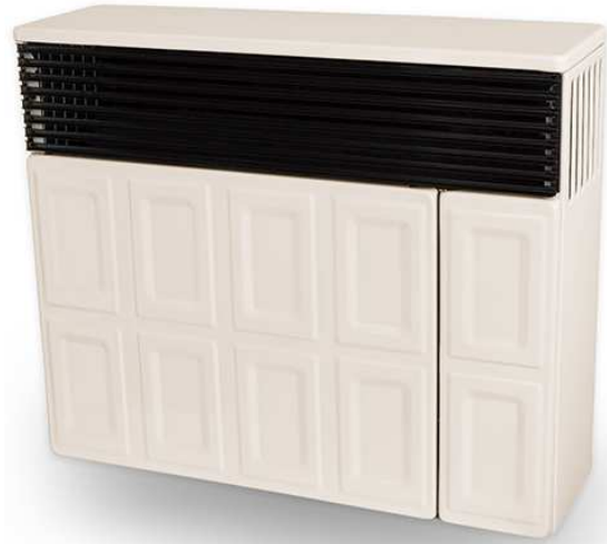
Convectore cu gaz LAMPART

principiul convecției naturale, energia termică degajată de arderea gazului fiind transmisă aerului din încăpere prin intermediul schimbătorului de căldură a convectorului.