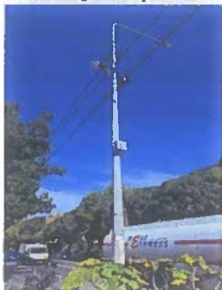
Foto - senzorul montat la Adjud

Calitatea aerului, preocuparea noastră, a tuturor!