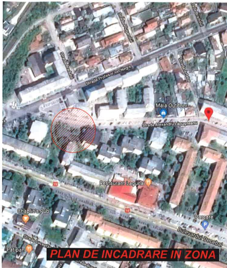
PLAN DE INCADRARE IN ZONA