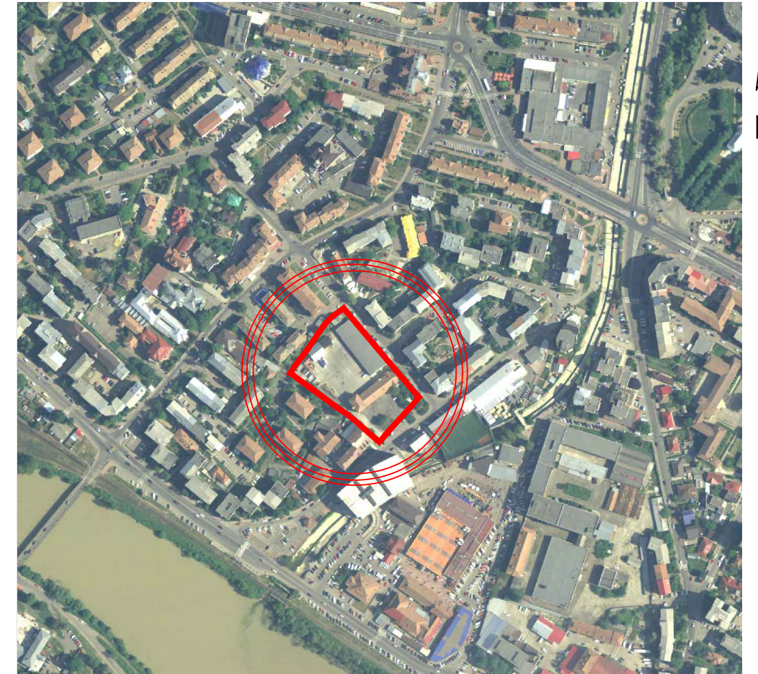
Inventar de coordonate puncte de contur sistem de proiectie Stereografic 1970