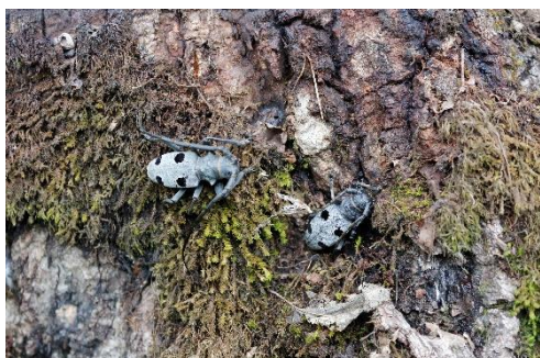
1089 Morimus funerus – Gândac

activităților de inventariere, cartare și evaluare ce au stat la baza elaborării Planului de management al sitului de importanță comunitară ROSCI0168 Pădurea Sarului a fost identificată prezența acestei specii în număr foarte mic, în perimetrul fondului forestier amenajat în cadrul U.P. I Stirbey.