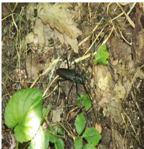
1088- Cerambyx cerdo – Croitorul mare al stejarului