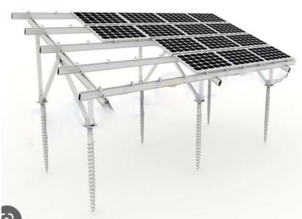
Figura 2. Soluția de montaj și suport a panourilor fotovoltaice

În acest sens se are în vedere o soluție de amplasare pe un sistem portant (grid) de tipul unei rețele de schele, ancorate în sol prin pivoți.