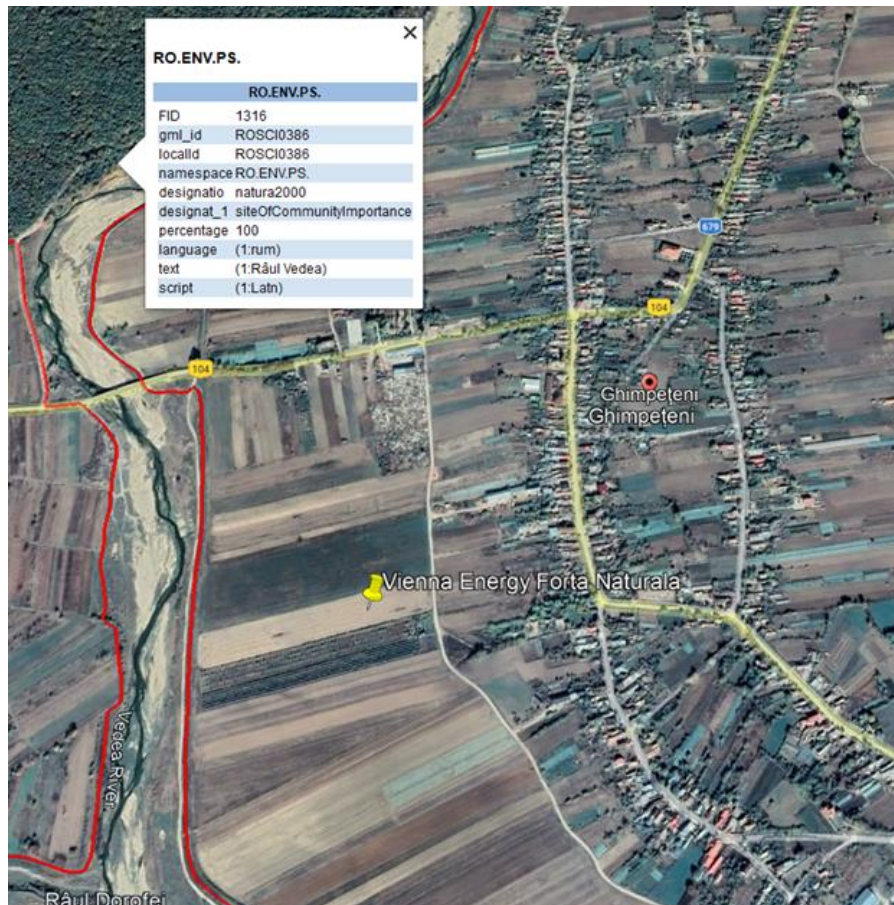
Figura 5. Amplasarea obiectivului în raport cu aria naturală ROSCI0386

Din punct de vedere al protecției naturii, perimetrul studiat se regăsește la limita sitului Natura 2000 ROSCI0386, la o distanță de aproximativ 50m față de acesta.