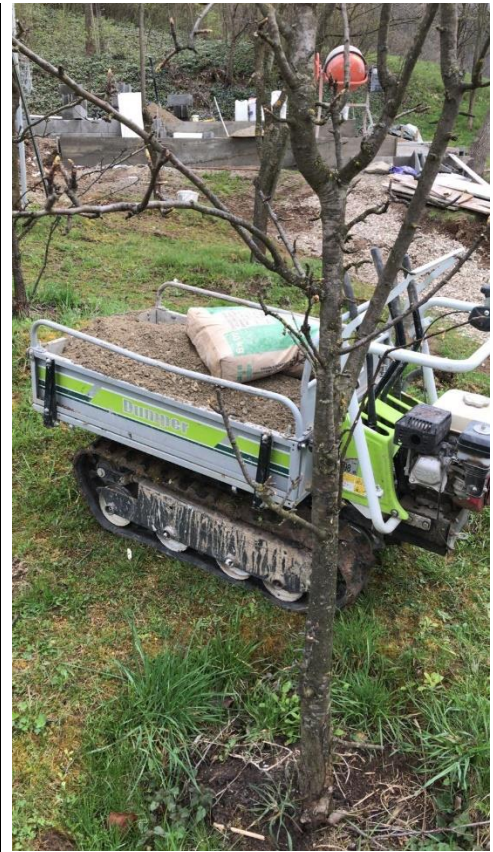
Figura 3. Minidumper pe șenile din cauciuc a cărui utilizare pe terenuri fragile asigură o protecție a solului și a covorului de vegetație

Transportul materialelor de construcții (kituri de montaj) până în proximitatea șantierului, se va asigura prin mijloace auto, utilizând căile de transport structurate și utilizându-se ca zone de parcare și staționare platformele de la nivelul acostamentelor.