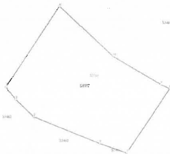
Figura 2 – Plan de situatie