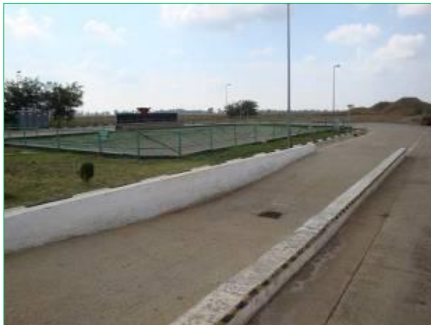
Rampa de spalare roti si bazinul de ape pluviale

Rampa de spalare a autovehiculelor este amplasata inaintea portii de iesire din depozit, si are rolul de igienizare a rotilor. Este o constructie subterana, avand dimensiuni 17.0 x 3.3 x 0.80 m, realizata prin sapatura; are un taluz de 1:1.5 din beton armat, fundat cu un strat de balast de 50 cm, peste care se afla un strat de geomembrana din PEID de 2 mm grosime.