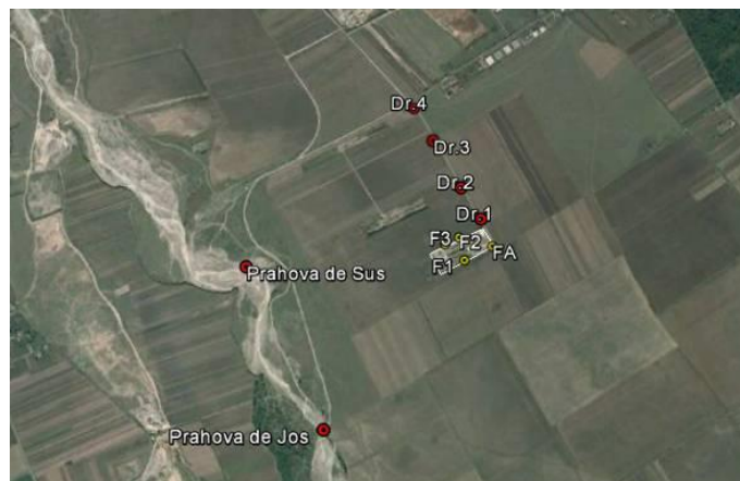
Fig.4.1. – Plan cu localizarea probelor de sol si apa – Studiu de Nivel 0