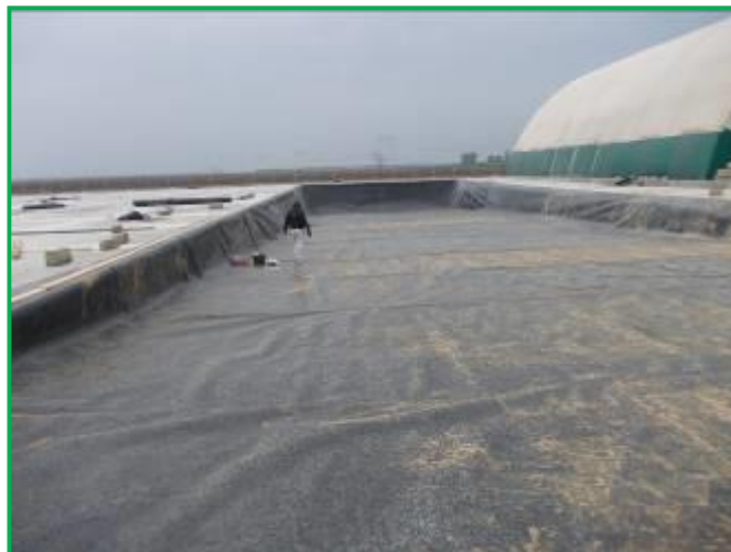
Impermeabilizare cu geomembrana PEHD la ansamblul rampa –cuva