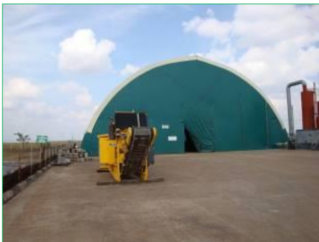
Incinta de tratare – cort industrial

- diferenta de 100 m 2 reprezinta cai de acces.