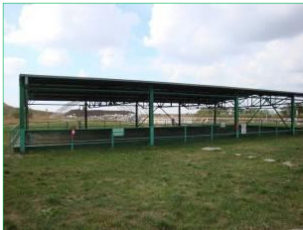
Bazinul decantor, acoperit

Apele din bazinul decantor, ape potential impurificate, sunt transportate cu autovidanja/cisterna la statia de epurare .