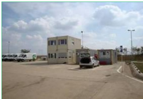
Platforma de parcare și zona administrativă

Platforma parcare este betonată și are dimensiunile de: 40 x 25 m.