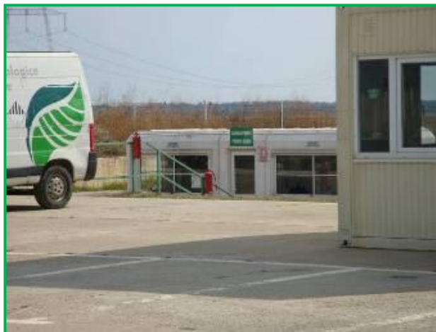
Cabina putului de alimentare cu apa

Rezervorul asigura atat debitul necesar pentru consumul de apa tehnologica si menajera cat si cel pentru incendiu.