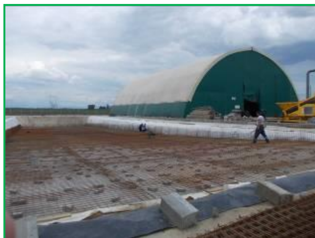
Geotextil protecție și armatura metalică la ansamblu rampa - cuva stocare/tratare deseuri