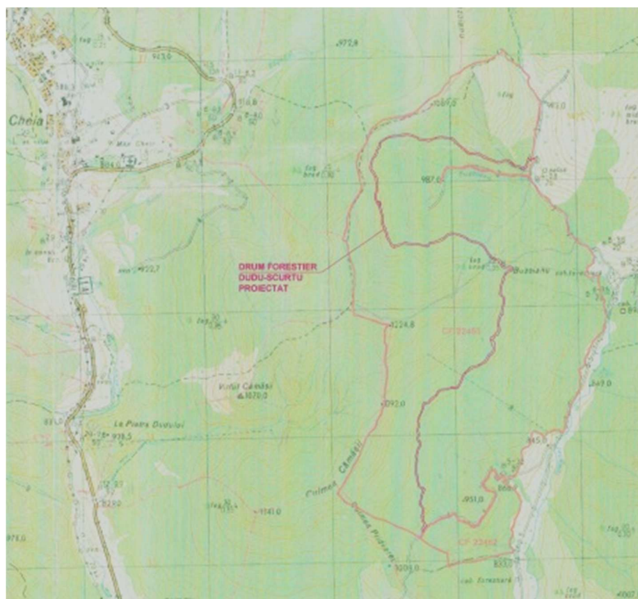
Fig. 1. Localizarea drumurilor propuse în cadrul proiectului

Drumurile forestiere asigură accesul în suprafața împădurită atât pentru utilajele pentru recoltarea materialului lemnos cât și pentru utilajele de intervenție în caz de calamitate (incendii, viituri, atacuri masive de insecte defoliatoare, etc.).