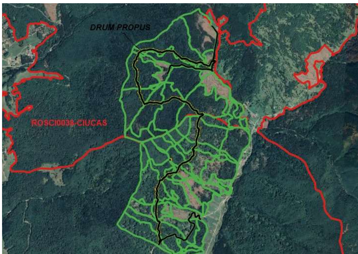
Foto. Suprapunere peste situl Natura2000