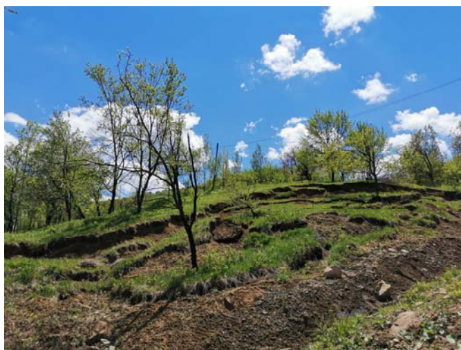
Alunecare zonă Strada Bugheni

Drumul constituie este singura cale de acces către un număr de aproximativ 22 de locuințe. La data constatării, accesul autospecialelor de intervenție în zona respectivă nu este practicabil.