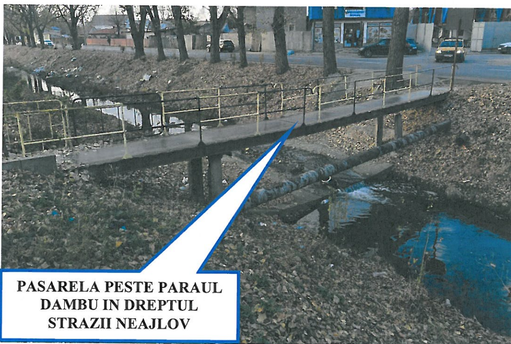
PASARELA PESTE PARAU DAMBU IN DREPTUL STRAZII NEAJLOV