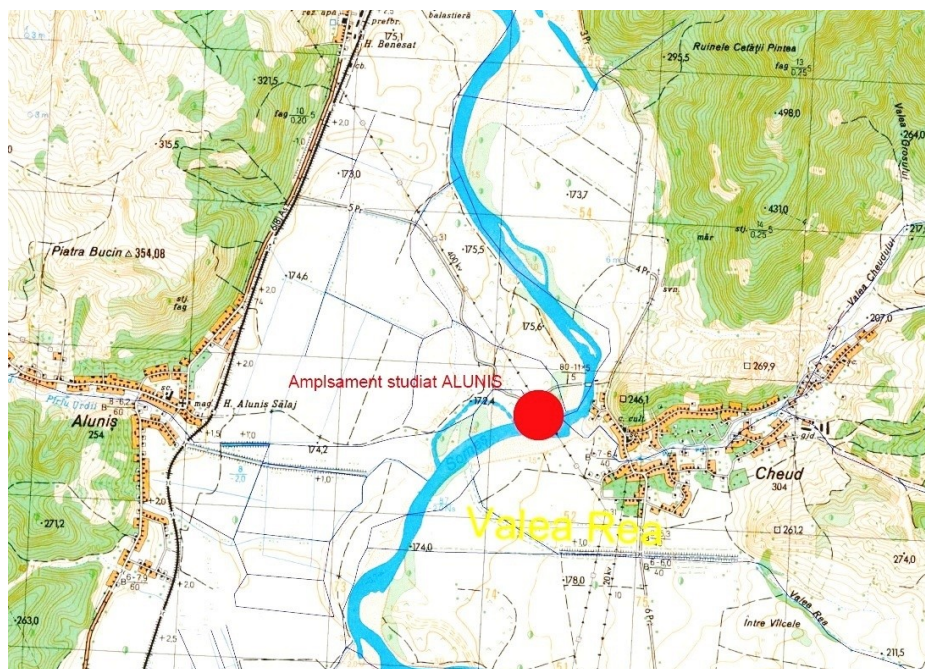
Fig. 1 – Plan de incadrare in zona

e) planșe reprezentând limitele amplasamentului proiectului, inclusiv orice suprafață de teren solicitată pentru a fi folosită temporar (planuri de situație și amplasamente);