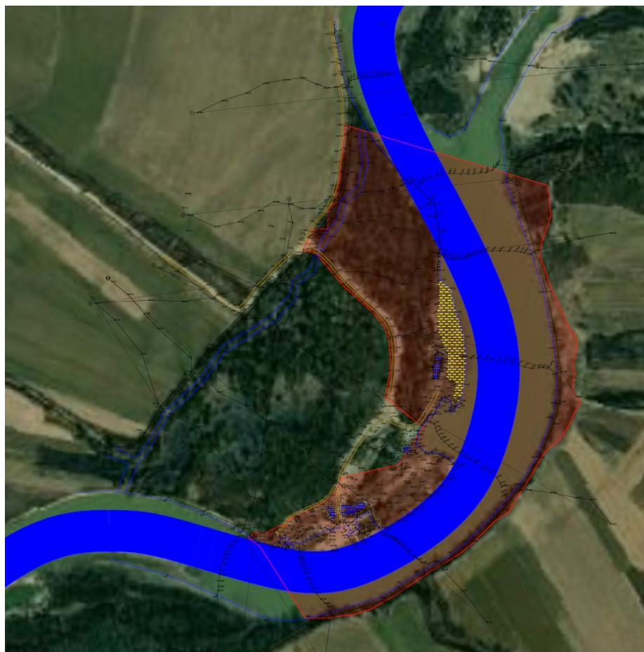
Fig. 2 – Plan al amplasamentului studiat