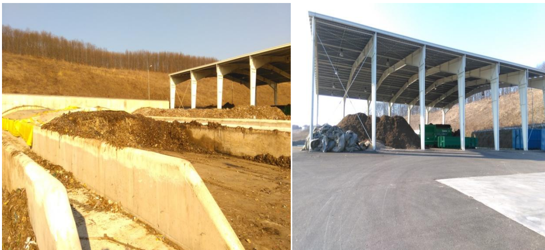
Fig.VII.1.3. Stația de tratare mecano-biologică Dobrin