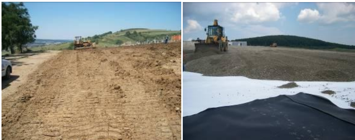
Fig.VII.1.4. Depozit în faza de închidere

În anul 2009, conform HG 349/2005 privind depozitarea deșeurilor, care transpune în legislația națională Directiva 1999/31/CE, activitatea la depozitul de deșeuri industriale al SC Rominserv Valves IAIFO Zalău a fost sistată. Depozitul a fost închis și ecologizat.