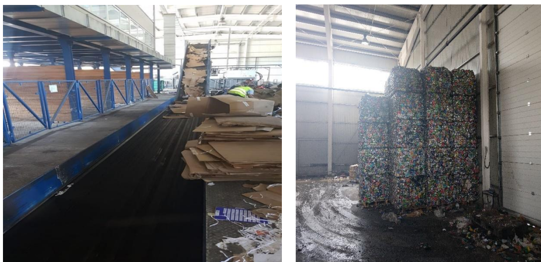
Fig.VII.1.2. Stația de sortare deșuri Dobrin