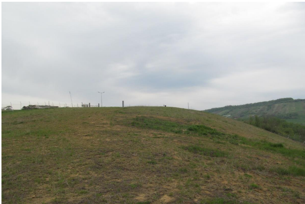
Fig.VII.1.10. Depozitul de deșeuri municipale din Cehu Silvaniei după închidere