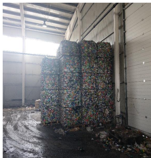
Fig.VII.1.2. Stația de sortare deșeurii Dobrin