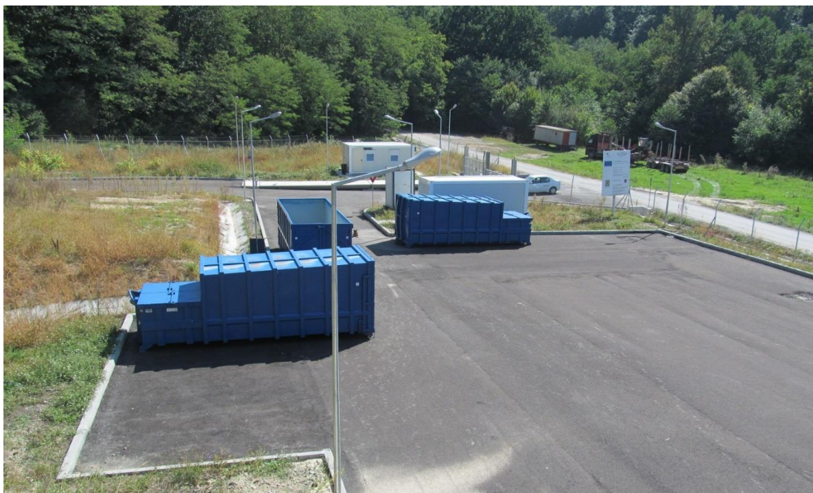
Fig.VII.1.7. Stația de transfer deșeuri din Sănmihaiu Almașului