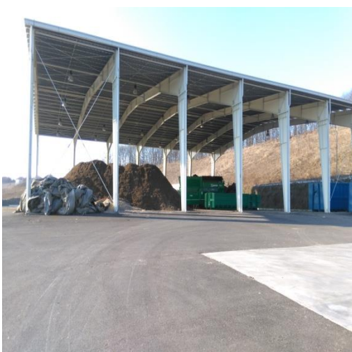
Fig.VII.1.3. Stația de tratare mecano-biologică Dobrin