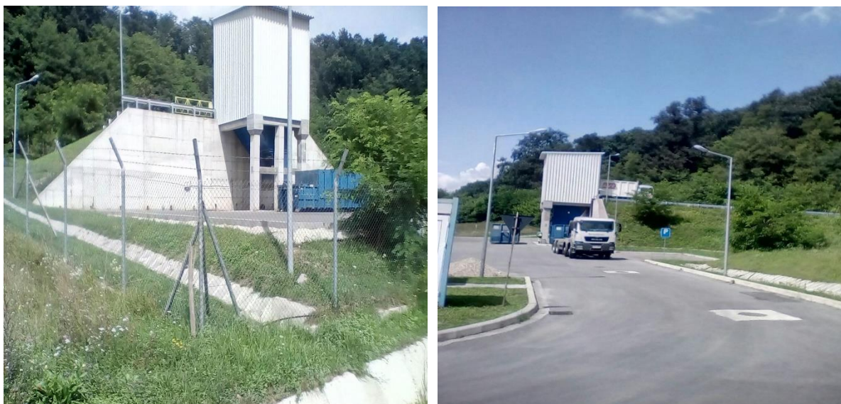
Fig.VII.1.6. Stația de transfer deșeuri din Surduc

În vederea realizării obiectivelor de reducere a cantităților totale de deșeuri depozitate, a reducerii cantităților de deșeuri biodegradabile depozitate, a obiectivelor de recuperare/reciclare/valorificare a deșeurilor de ambalaje, a gestionării eficiente și sigure a deșeurilor municipale, s-a inițiat la nivelul județului Sălaj, proiectul Sistem de Management Integrat al Deșeurilor. Valoarea totală a proiectului este de cca. 35.000.000 euro. Finanțarea se realizează prin POS Mediu. Contractul de finanțare a fost semnat la finele anului 2010.