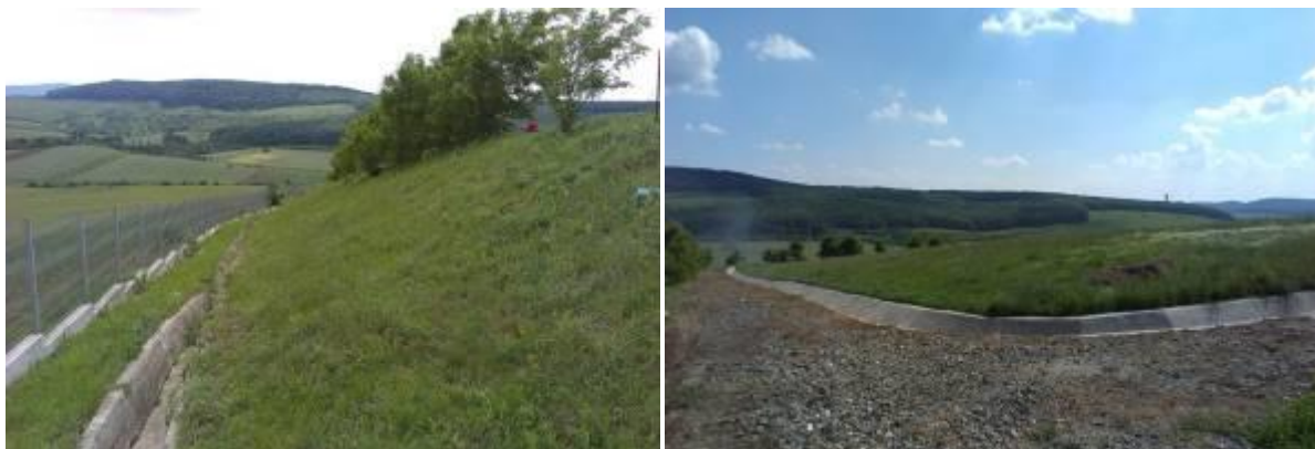
Fig.VII.1.5. Depozit în faza de post-închidere

În anul 2009, și SC Silcotub SA și-a sistat activitatea la depozitul de deșeuri nepericuloase. Depozitul a fost închis și ecologizat.