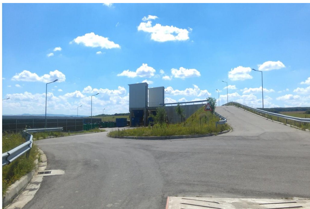
Fig.VII.1.8. Stația de transfer deșeuri din Crasna