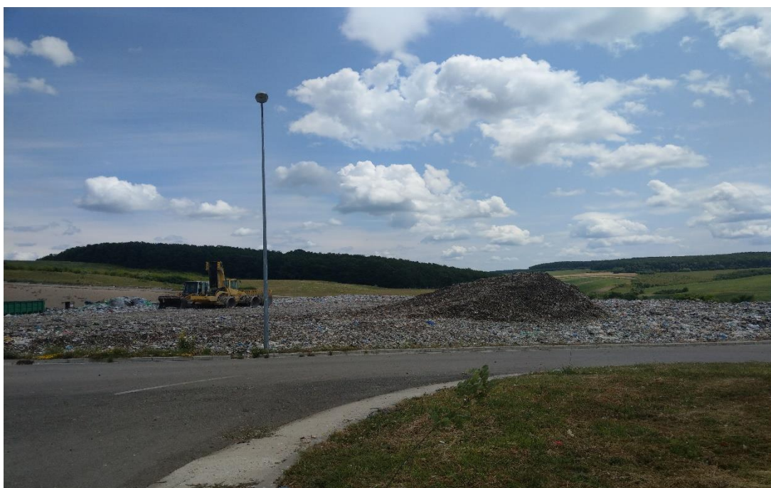
Fig.VII.1.9. Depozitul de deșeuri ecologic Dobrin