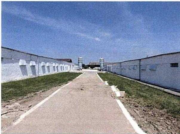
Cale de acces între hale