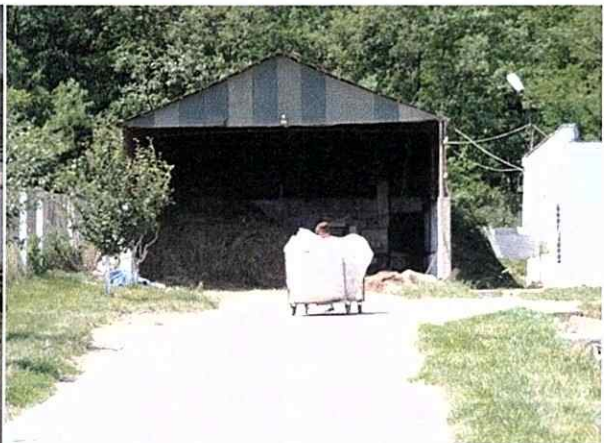
Depozit de așternut