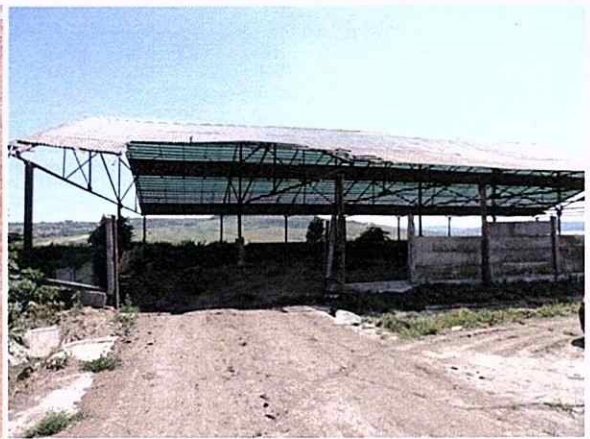
Platformă betonată pentru dejectii