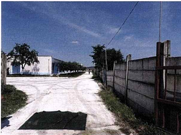
Filtru rutier și căi de acces în interiorul fermei