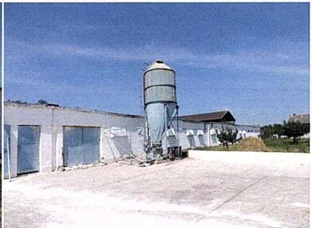
Buncăr de stocare a furajelor