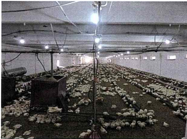
Interior hală de creștere pui de carne