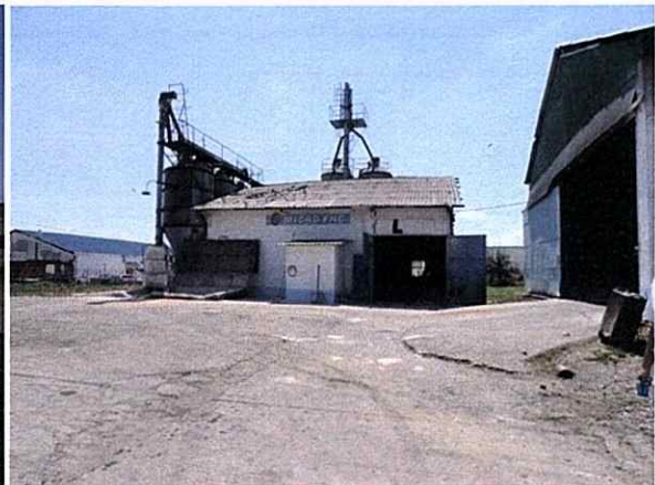
Moară de cereale