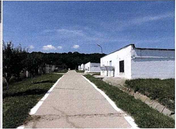
Căi de acces în interiorul fermei