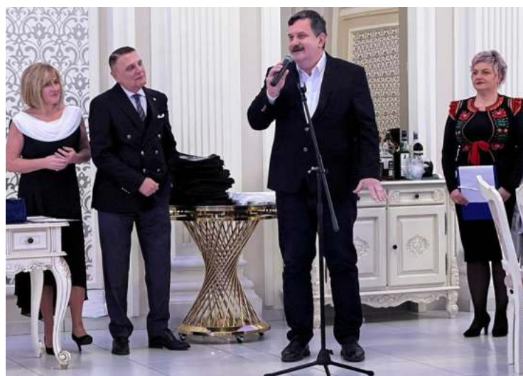
Oamenii de afaceri sunt cei care susțin efectiv economia județului

plin de bucurii și mediului privat și mediului administrativ, iar când mă uit în sală, mă bucur că văd fețe cunoscute și din contractele publice”, a precizat președintele Consiliului județean Pataki Csaba.