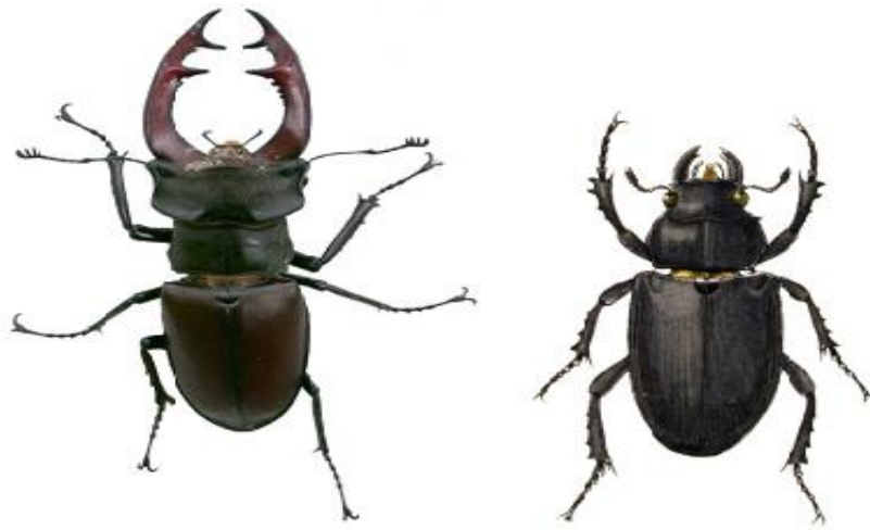
Foto 4.4. Rădașca ( Lucanus cervus ) exemplar mascul- stanga și exemplar femelă- dreapta

Regim alimentar: larva se hrănește cu lemn putred de Quercus , adulții nu se hrănesc. Se întâlnește în pădurile de cvercinee. Preferă arborii bătrâni cu trunchiul de cel puțin 25-30 cm diametru. Adulții sunt întâlniți pe trunchiurile și ramurile arborilor, uneori pe pământ sau în zbor.