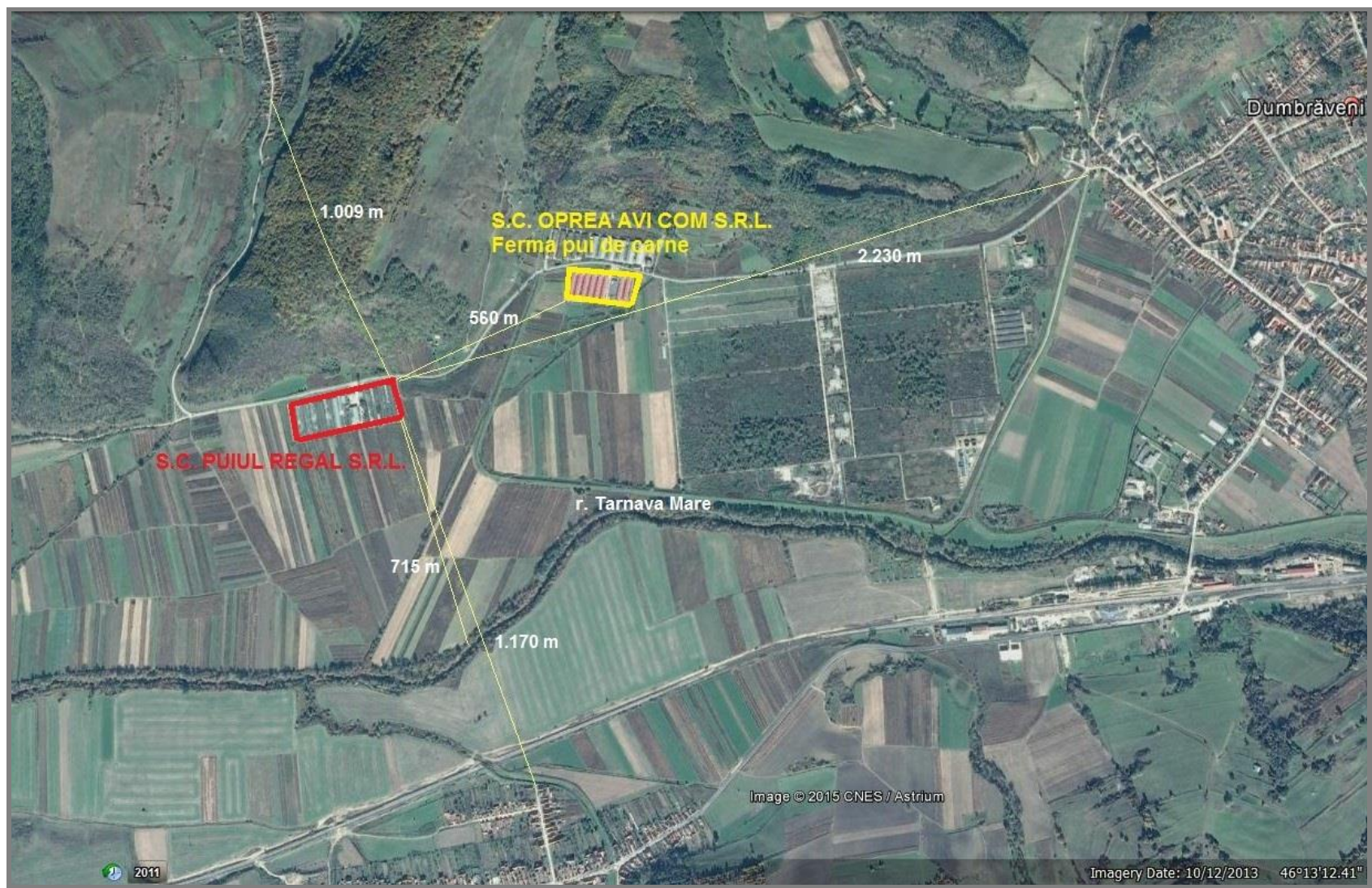
Fig. 1 – Amplasamentul fermei S.C. PUIUL REGAL S.R.L.