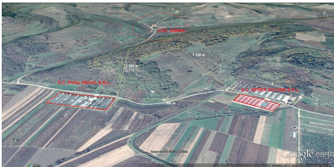
Fig. 3 – Amplasarea celor doua ferme in raport cu zona rezidentiala a localitatii Ernea