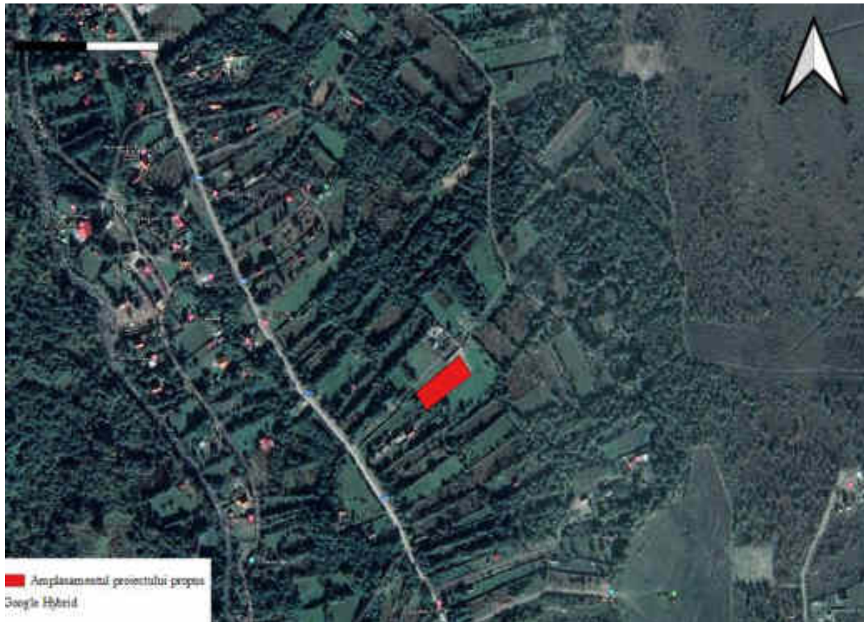
Fig. 1 Plan de încadrare în zonă, UAT Avrig (poligon roșu- amplasamentul proiectului)

Prin proiectul propus se dorește Construire unei case de vacanță în orașul Avrig, str. Valea Avrigului, nr. 209, identificat prin număr cadastral 109600, număr de carte funciara 109600 – Avrig, nr. parcela 3984/273/1, județul Sibiu.