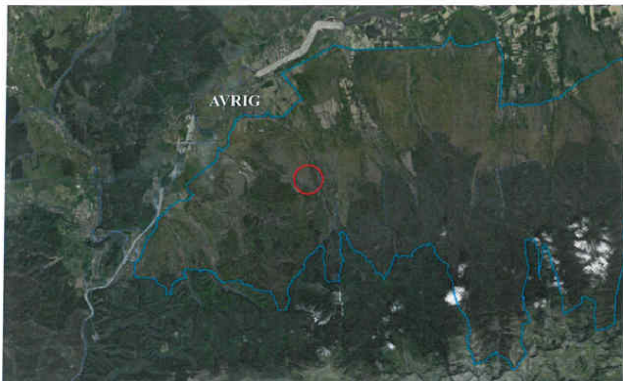
Figura nr. 1 – Relația amplasamentului proiectului cu aria de protecție special avifaunistică ROSPA0098 Piemontul Făgăraș

Amplasamentul proiectului se află localizat în interiorul ariei de protecție special avifaunistică ROSPA0098 Piemontul Făgăraș (figura nr. 1).