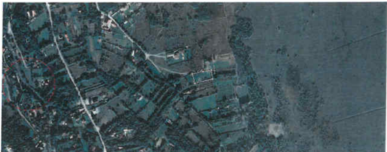
Figura nr. 2 – Aspect privind încadrarea amplasamentului proiectului în teritoriu

e) se va estima impactul potențial al proiectului asupra speciilor și habitatelor din aria naturală protejată de interes comunitar: - investiția nu prezintă impact potențial. Se menționează că pe durata lucrărilor de execuție vor exista zgmoțoe caracteristice lucrărilor de execuție a construcțiilor.