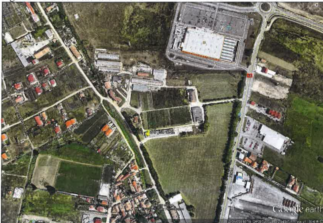
Figura 1: Plan de încadrare în zona

Amplasamentul este situat în raza administrativ-teritorială a județului Sibiu, în municipiul Sibiu, pe str. Drumul Ocnei, nr. 4, conform planului de încadrare în zona prezentat în figura 1.