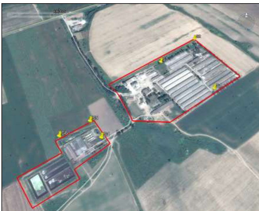
Fig. – Puncte investigate privind calitatea solului, situația de referință – anul 2014