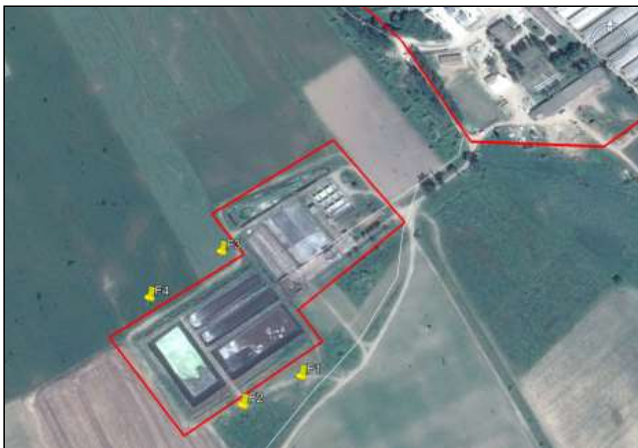
Fig. – Puncte investigate privind calitatea apelor subterane – amonte si aval fata de zona de depozitare dejectii

Monitorizarea calitatii apei freatic pe amplasamentul fermei s-a efectuat conform cerintelor Autorizatiei integrate de mediu nr. SB01/21.01.2015. si conform Autorizatiei de gospodarirea apelor nr. SB94/23.08.2017 (autorizatie care a fost ulterior revizuita, in decembrie 2019).