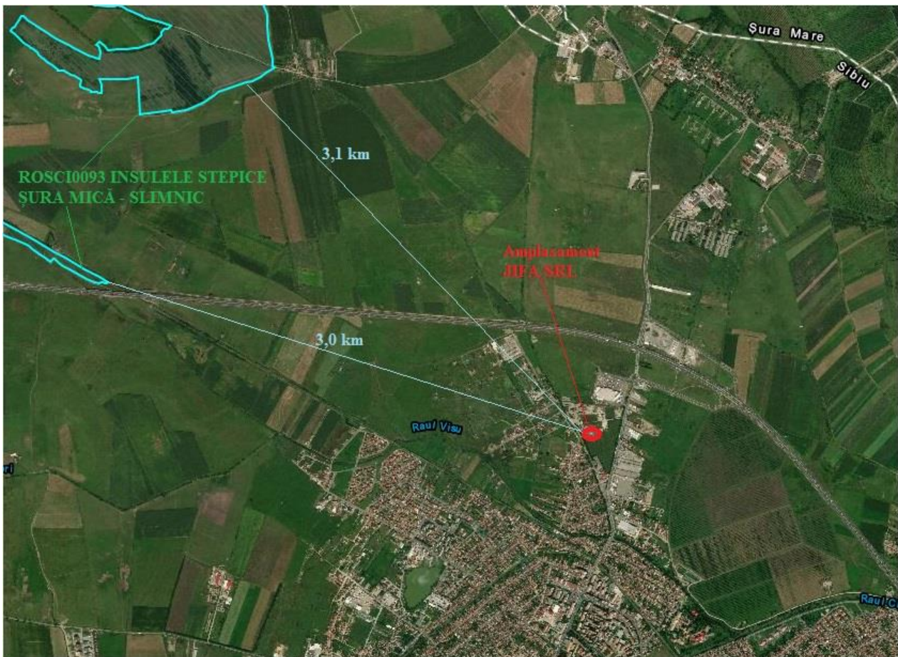
Fig.4 - Relația amplasamentului cu ariile naturale protejate

2.14. Condiții de construcție, starea construcțiilor de pe amplasament, perspective privind îmbunătățirea și dezvoltarea construcțiilor