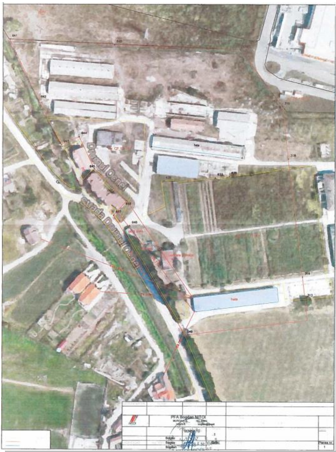
Figura 2: Distanțe față de locuințe