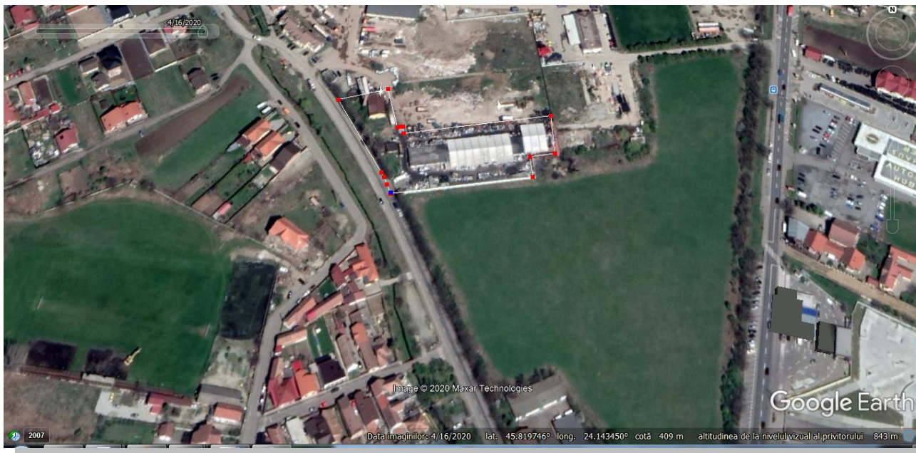
Figura 1: Plan de încadrare în zonă

Din punct de vedere hidrologic, amplasamentul se află pe terasa superioară a cursului de apă Valea Șerpuită, cod cadastral VIII-I.120.6.3.